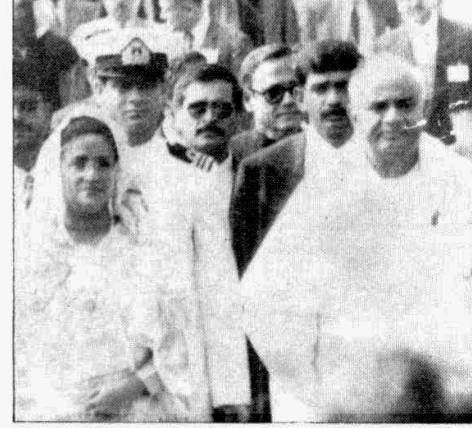
Prime Minister Sheikh Hasina leading her Indian counterpart H D Deve Gowda out of the airport yesterday.