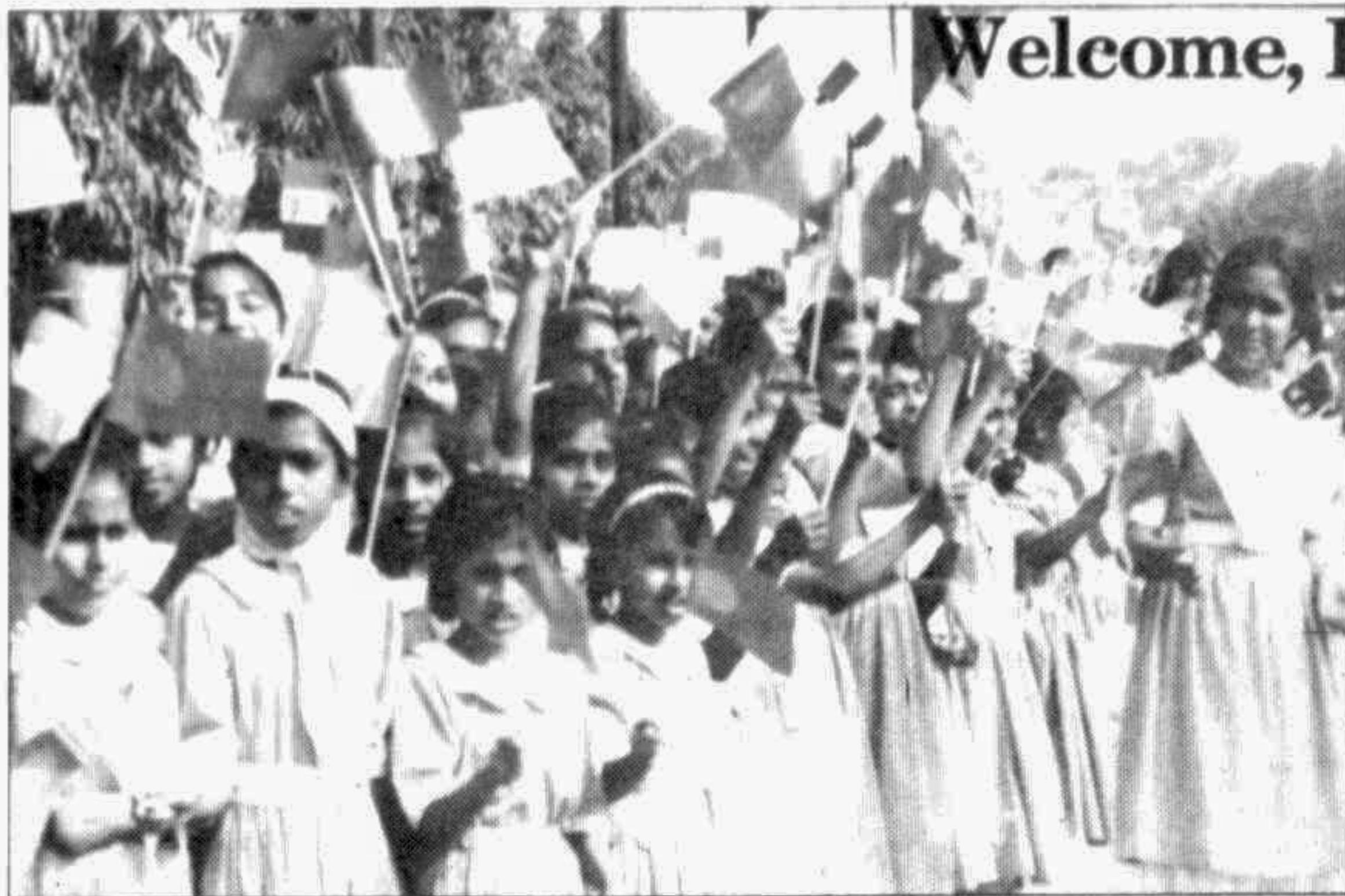
Children waving miniature flags of the two countries outside Zia International Airport welcoming the Indian Prime Minister yesterday.