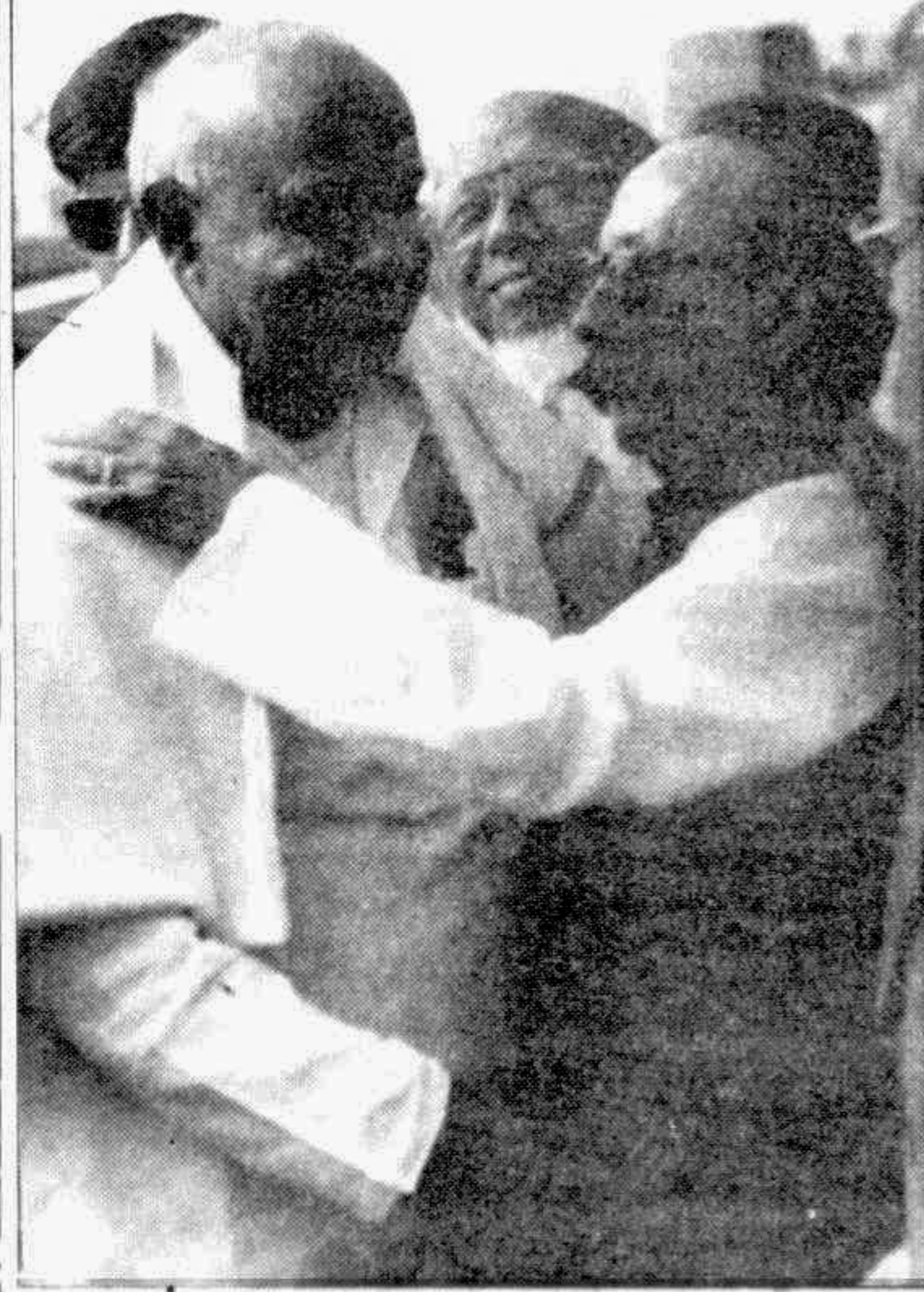
Indian Prime Minister H D Deve Gowda embracing LGED and Cooperatives Minister Zahirul Rahman while he was being introduced to the dignitaries at the airport yesterday.