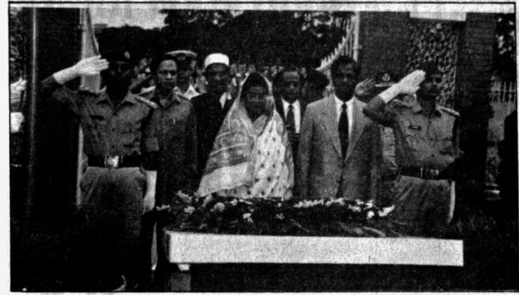
১৭ জুলাই ১৯৯৬, রাজারবাগ শহীদ স্মৃতিসৌধে পুষ্পস্তবক অর্পন করেন মাননীয় প্রধানমন্ত্রী শেখ হাসিনা