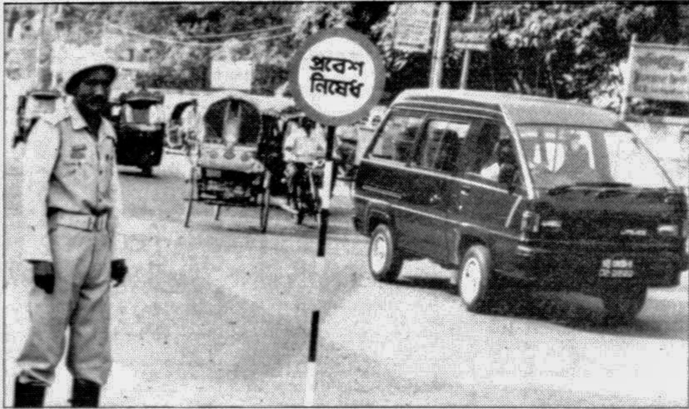
Baily road is a case in point.

The decision to transform Baily Road into a one-way affair is actually an instance of chopping one's head to cure headache. Consequently, the atrophies are: you have to take a detour to avoid entry into the Baily road. The options are the parallel roads (Malibag-Magbazar road, Kakrail road, Habibullah Bahar College-Circuit House road, and Shidheswari road). These roads are already overburdened with all modes of transports, and the by-lanes are too narrow to take an extra load. Thereby, the street junctions at Kakrail, Shantinagar, Malibag, Mouchak,