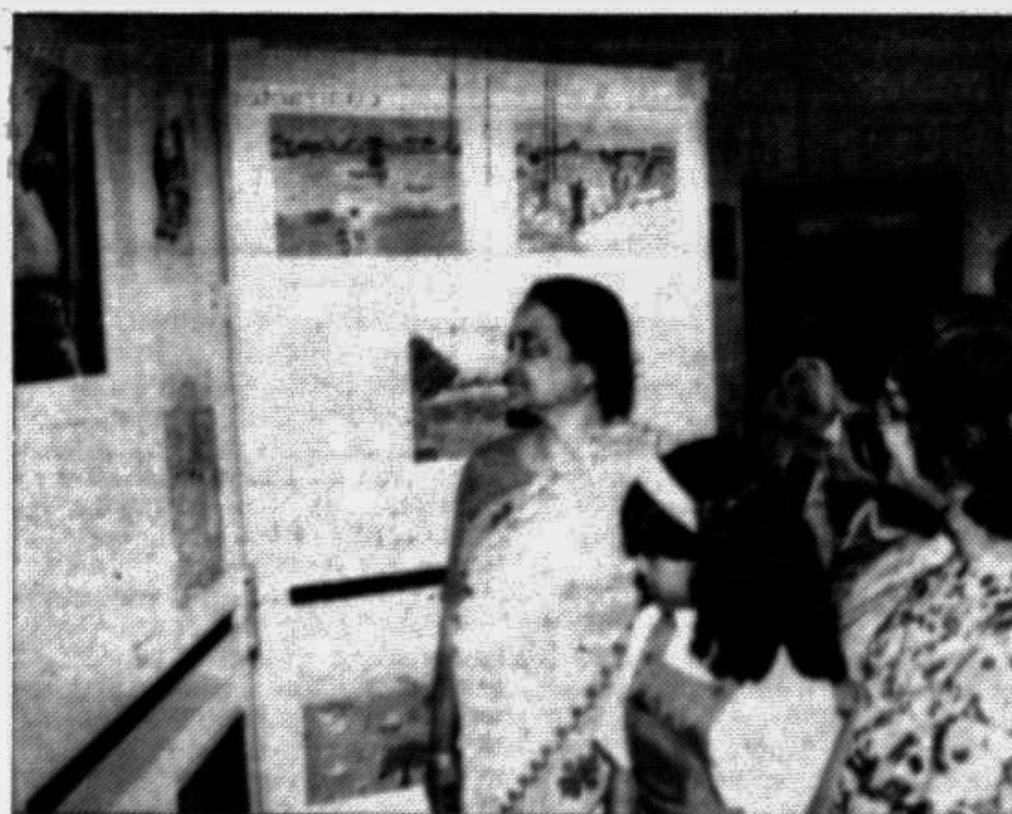
Visitors at an art exhibition arranged by the Sunbeams School at Alliance Francaise in the city yesterday