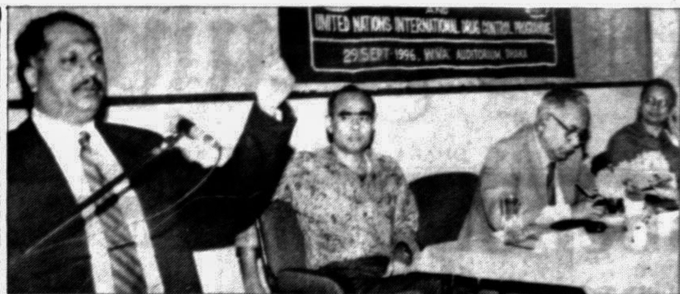
State Minister for Law and Justice Abdul Matin Khasru addressing the inaugural session of a workshop on 'Narcotics, law enforcement and legal assistance' in the city yesterday.

President Biswas said, as freedom of the press has been ensured, more and more newspapers and periodicals are coming out and the people are availing themselves of the opportunity to express their opinions freely.