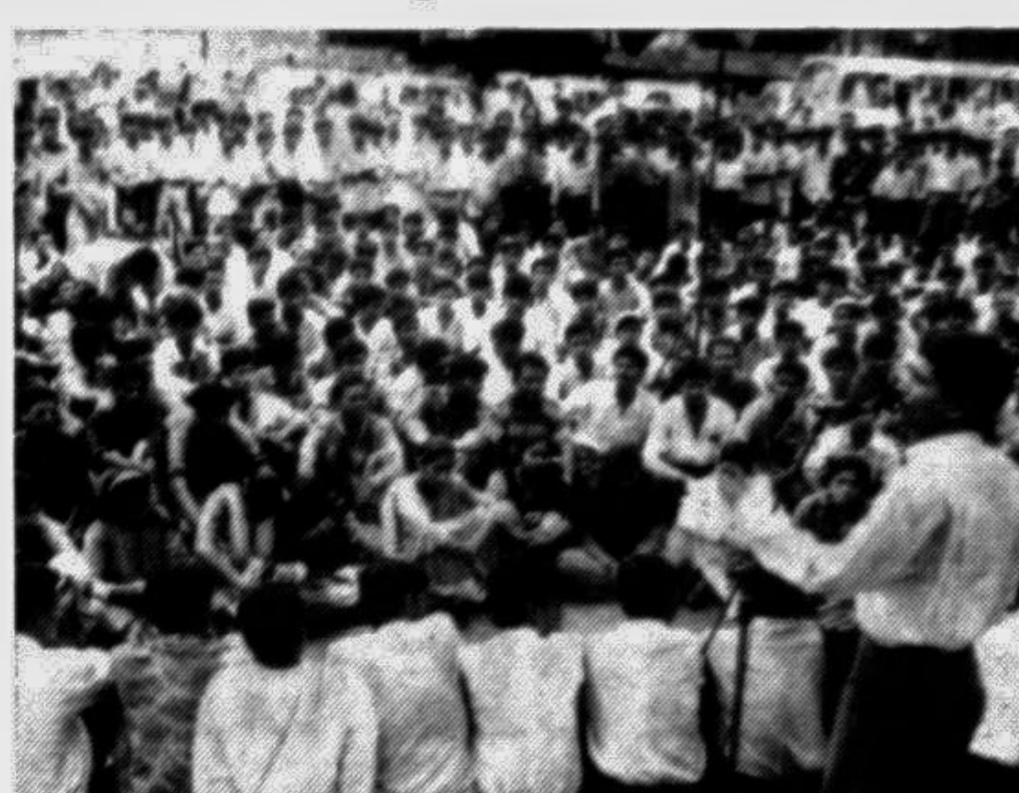
Enamul Haq Shamim, president, Bangladesh Chhatra League addressing a rally in front of the Jatiya Press Club yesterday.

Five storied newly constructed (Ground & first floor) one unit, 4 single flat (2600 sq ft), each 4 bed attached bath, Drawing, Dining, Servants, Cook house having total 14 car parking for Embassy, NGO, Foreigners, Construction Firm etc. House No-14, Road-5, Sector-1, Uttara. Telephone: 886839 (Office), 896830 (Residence). S-492