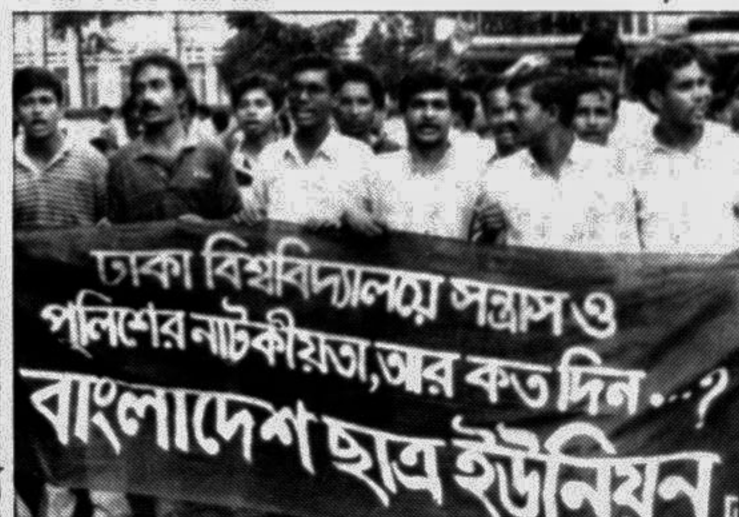
Activists of Bangladesh Chhatra Union brought out a procession on Dhaka University campus yesterday denouncing recent police action at DU.