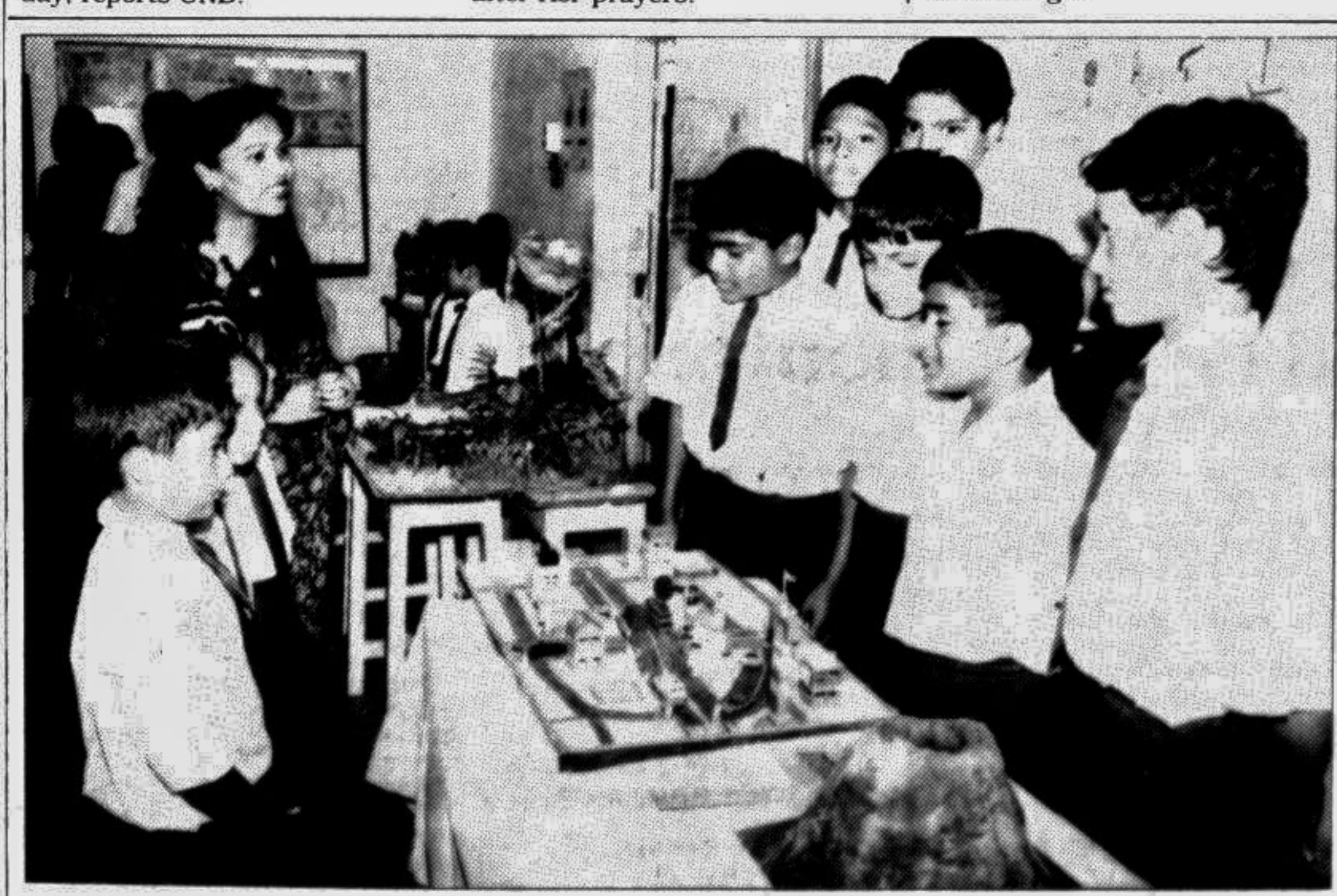
Eton International School held its annual science fair at the school premises in Dhanmondi yesterday.

The primary scholarship examinations for the year 1996 will be held December 18-19, said an official handout yesterday, reports UNB.