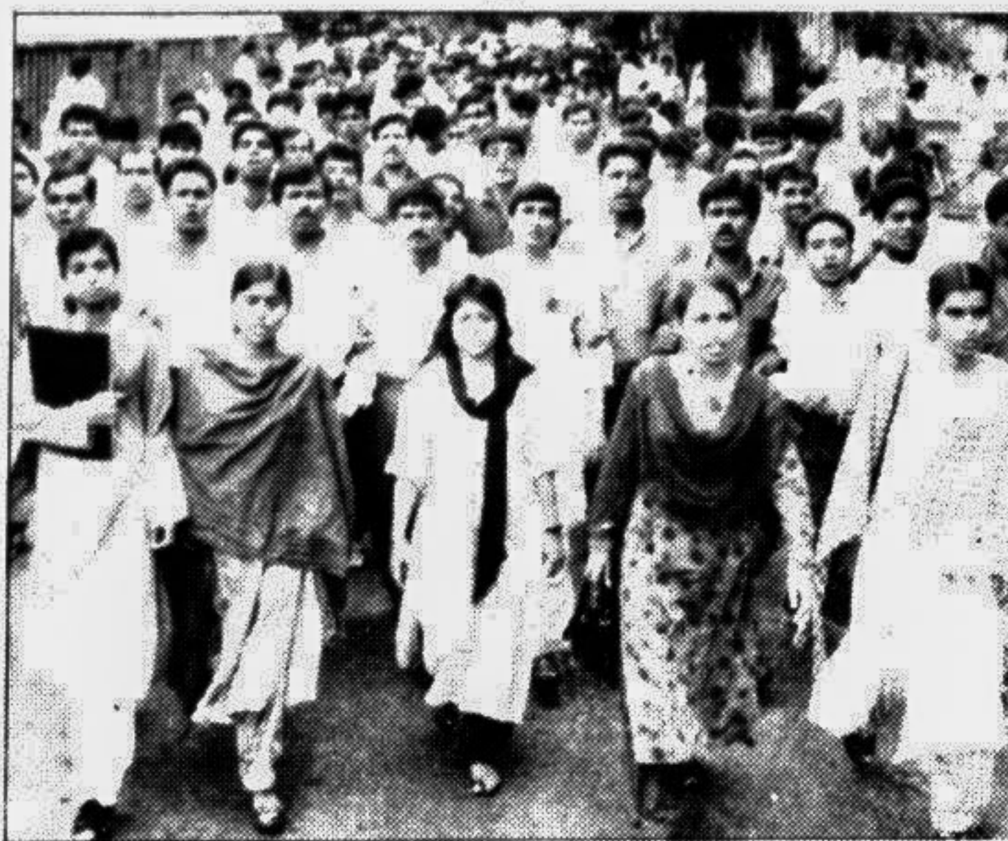
Bangladesh Chhatra League BCL (S-P), the student wing of the ruling party, brought out a procession on the Dhaka University campus yesterday in connection with the observance of the National Mourning Day August 15.