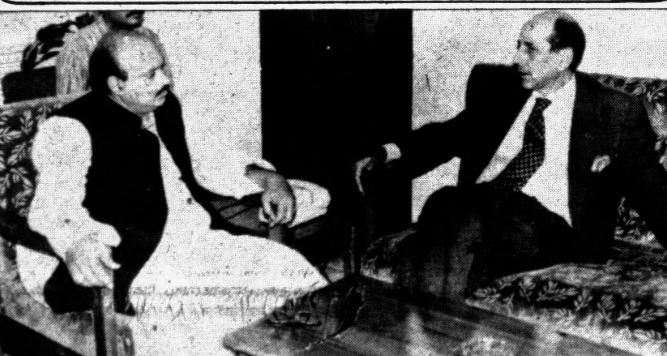
Italian envoy to Bangladesh Raffaele Miniero called on Post and Telecommunications Minister Mohammad Nasim at his office in the city yesterday.

Taking into consideration its space constraint and other restrictions, we may as well turn a blind eye to the many shortcomings of the park. At least this is a place where the whole family can enjoy themselves. With an improvement in maintenance, the park will be a source of greater joy one day, hopefully!