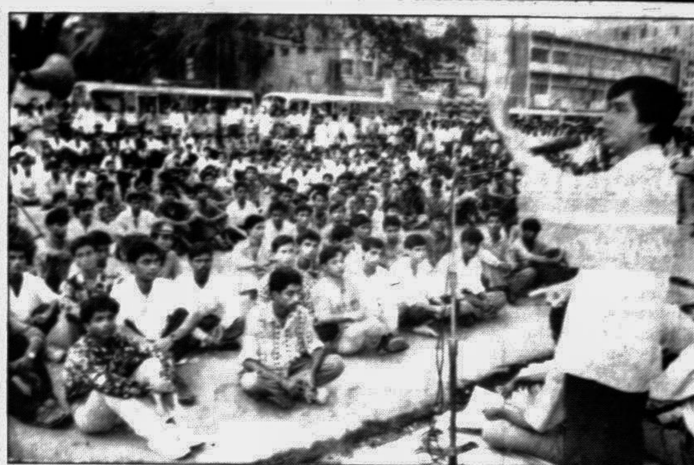
A BCL (S-P) rally in front of the Jatiya Press Club yesterday.

If different parties come to power only then people can compare their competence and a healthy competition among the parties can be ensured for the welfare of the