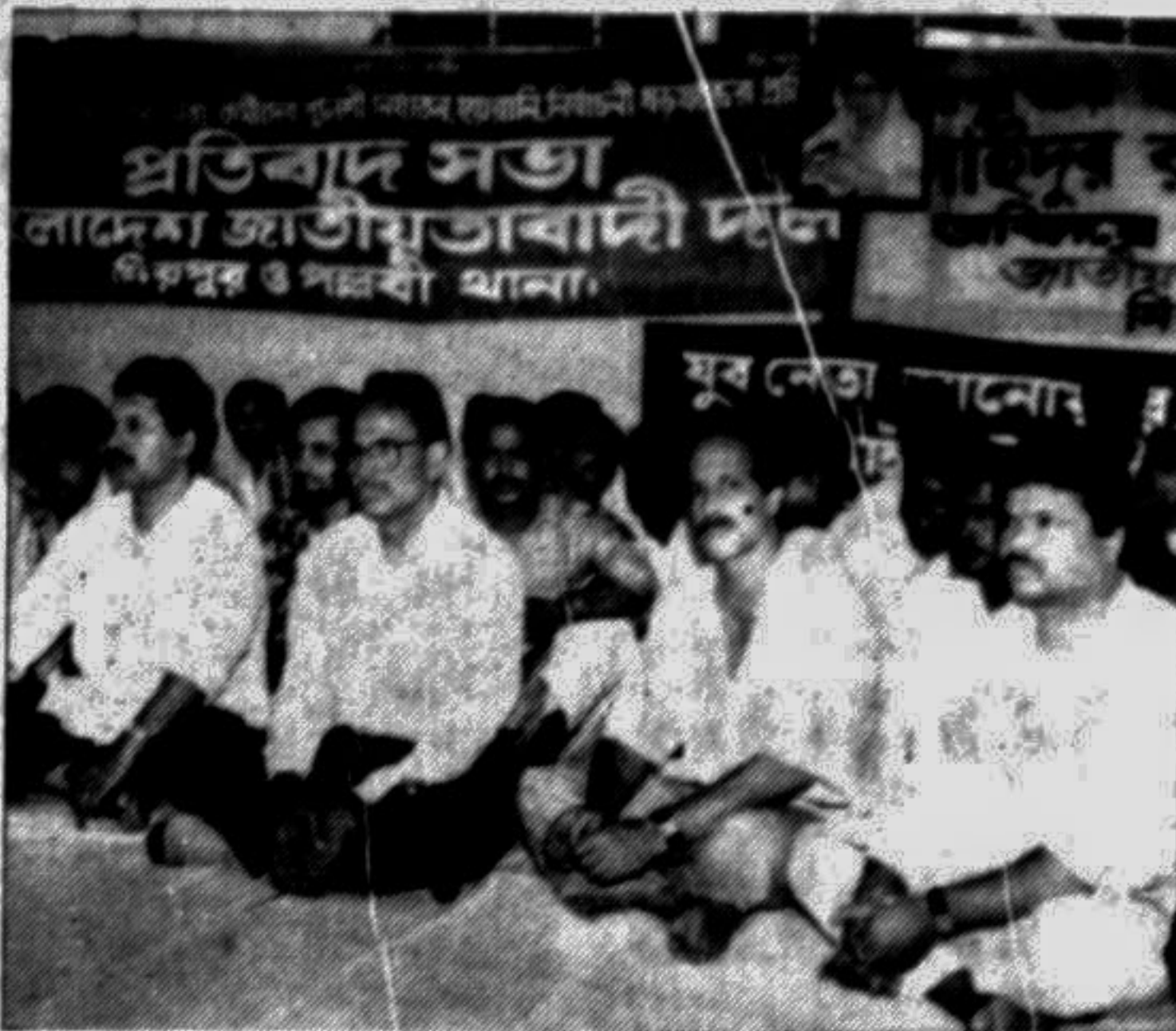
The Bangladesh Jatiyatabadi Dal (BNP), Mirpur Thana unit, held a meeting yesterday protesting arrest of a JCD leader on Monday.