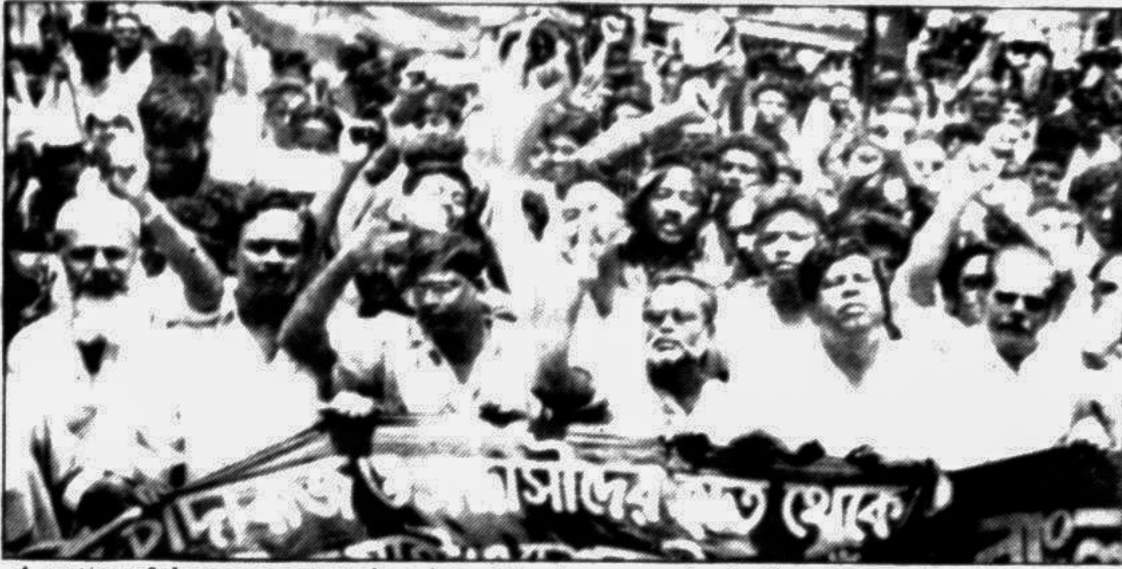
A section of the transport workers brought out a procession in the city yesterday denouncing terrorism.

Suspension of phone services Telephone calls in-between four groups of numbers of Motijheel, Sher-e-Banglanagar and Maghbarah digital exchanges will remain suspended for an hour from 8 pm tomorrow, reports UNB. The groups are 955 and 956 of Motijheel, 911 and 912 of Sher-e-Banglanagar and 933 of Maghbarah exchanges.