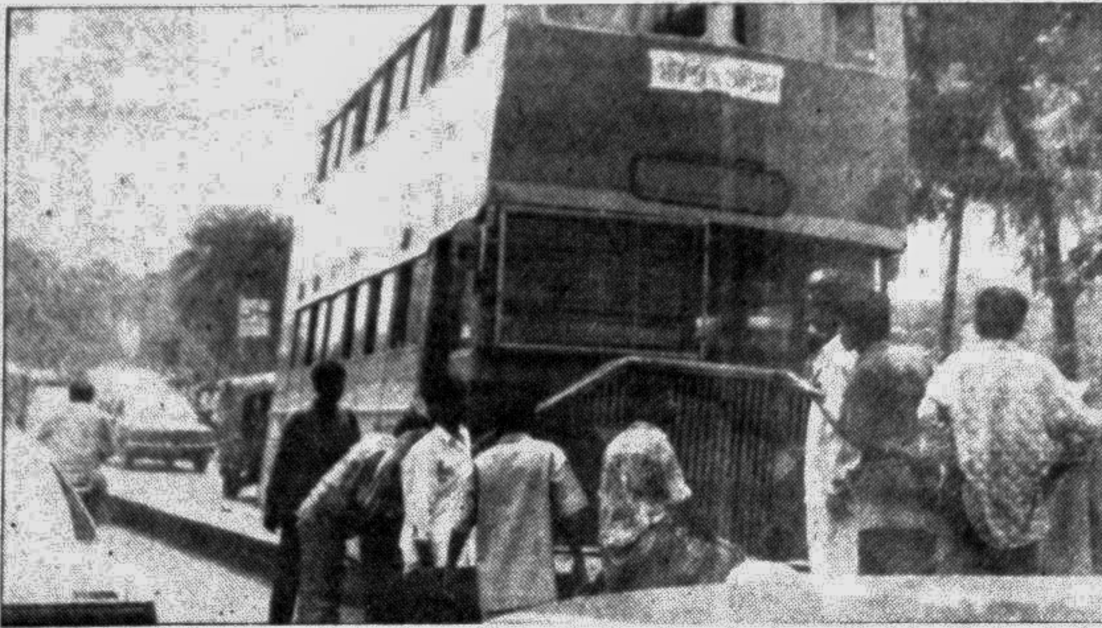
This double-decker swerved onto the road island in the city yesterday as its driver lost control over the vehicle.