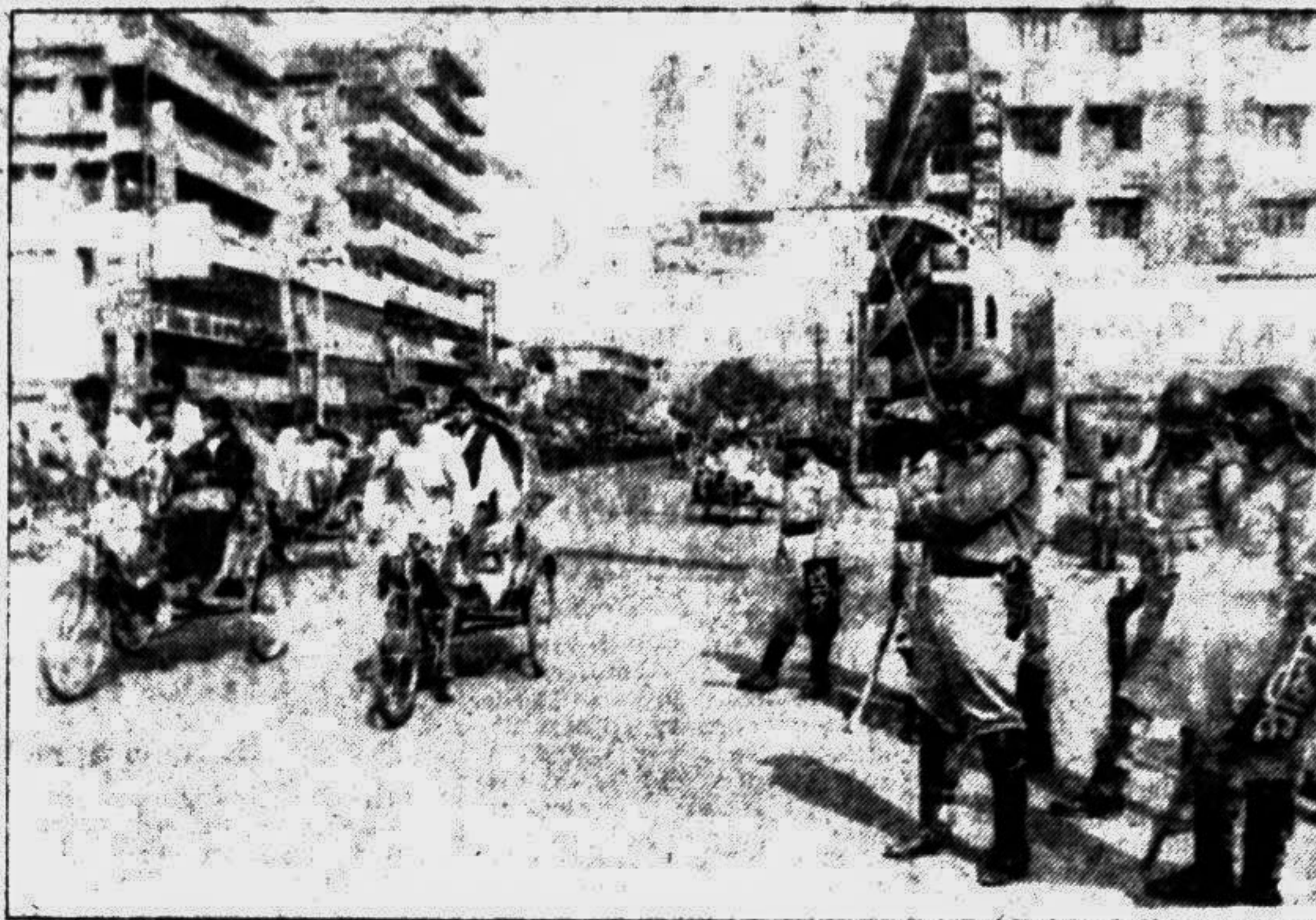
City's Bijoy Nagar area during hartal hours yesterday.