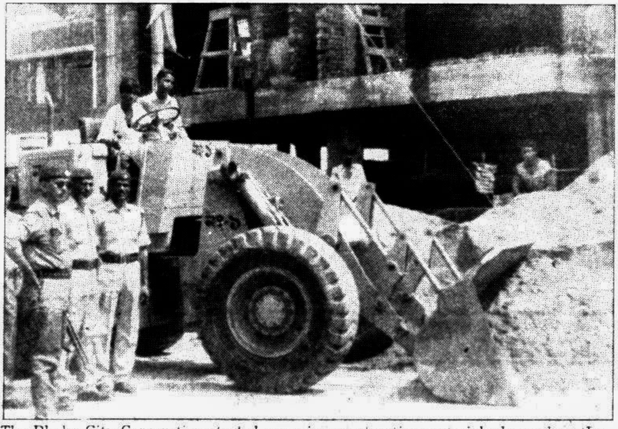
The Dhaka City Corporation started removing construction materials dumped on the roads and pavements in Dhanmondi area yesterday.