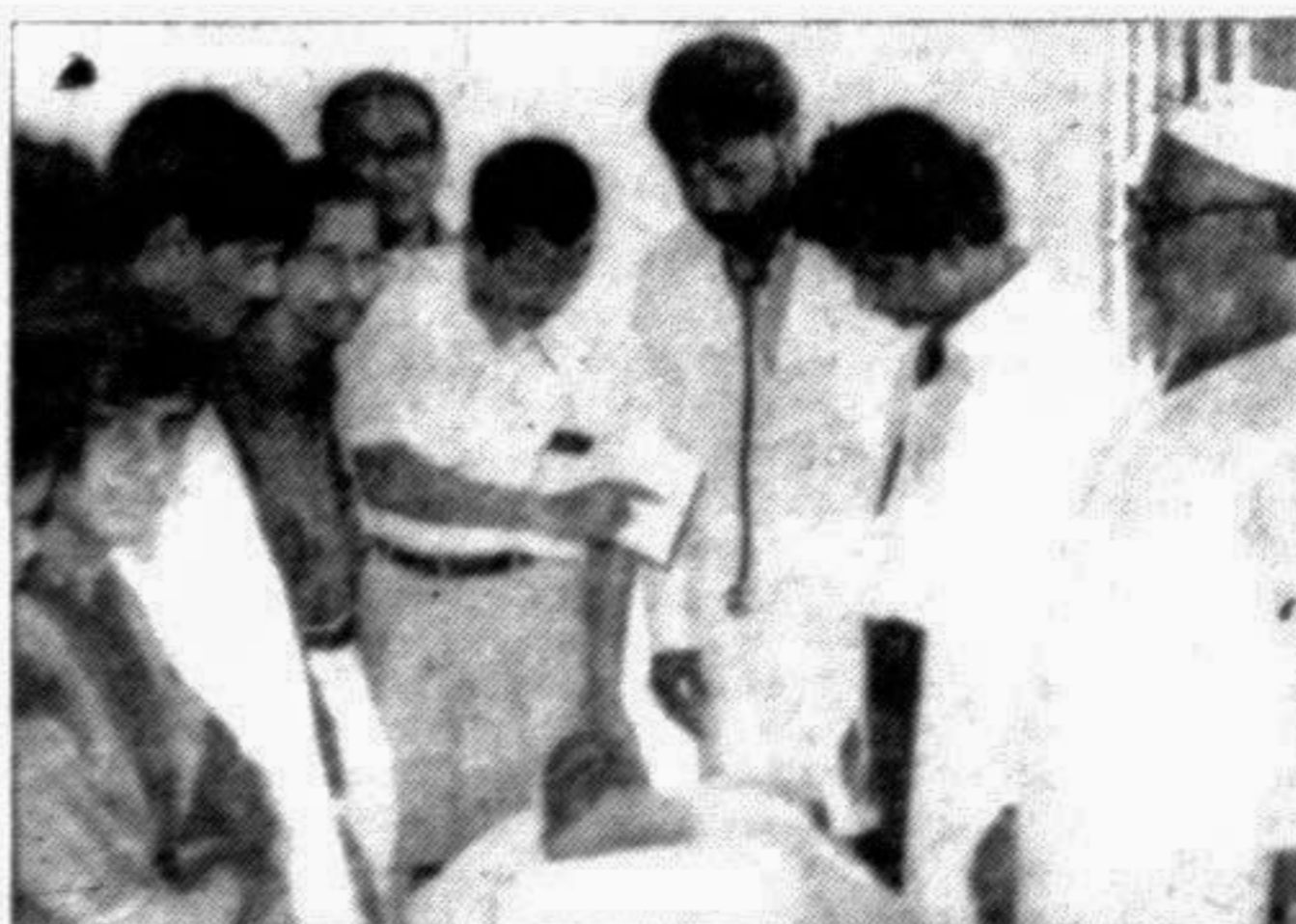
Bangabandhu Free Friday Medical Services provided treatment to the poor patients of the city's Mirpur area at Kazifuri Govt Primary School premises.

Zahir Raihan Film Society: The society has organised an Indian film session. Mrigaya (The Royal Hunt) by Mrinal Sen will be screened on the opening day. Venue: Indian High Commission auditorium, Road 2, Dhanmondi. Time: 6 pm.