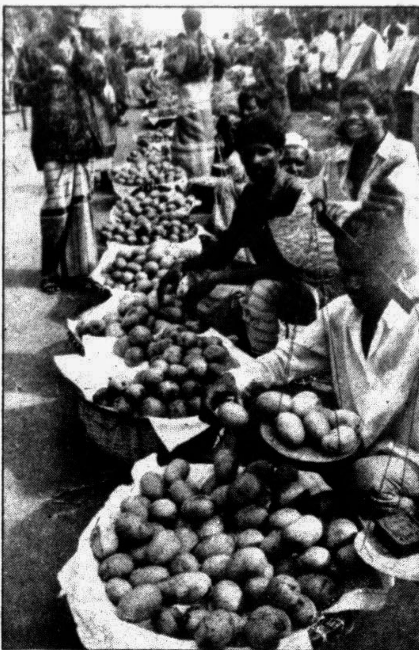
Mangoes of different varieties have appeared in the city markets in quantities. The relatively low price this year has brought this summer delicacy within the reach of the common man. This photo was taken yesterday.