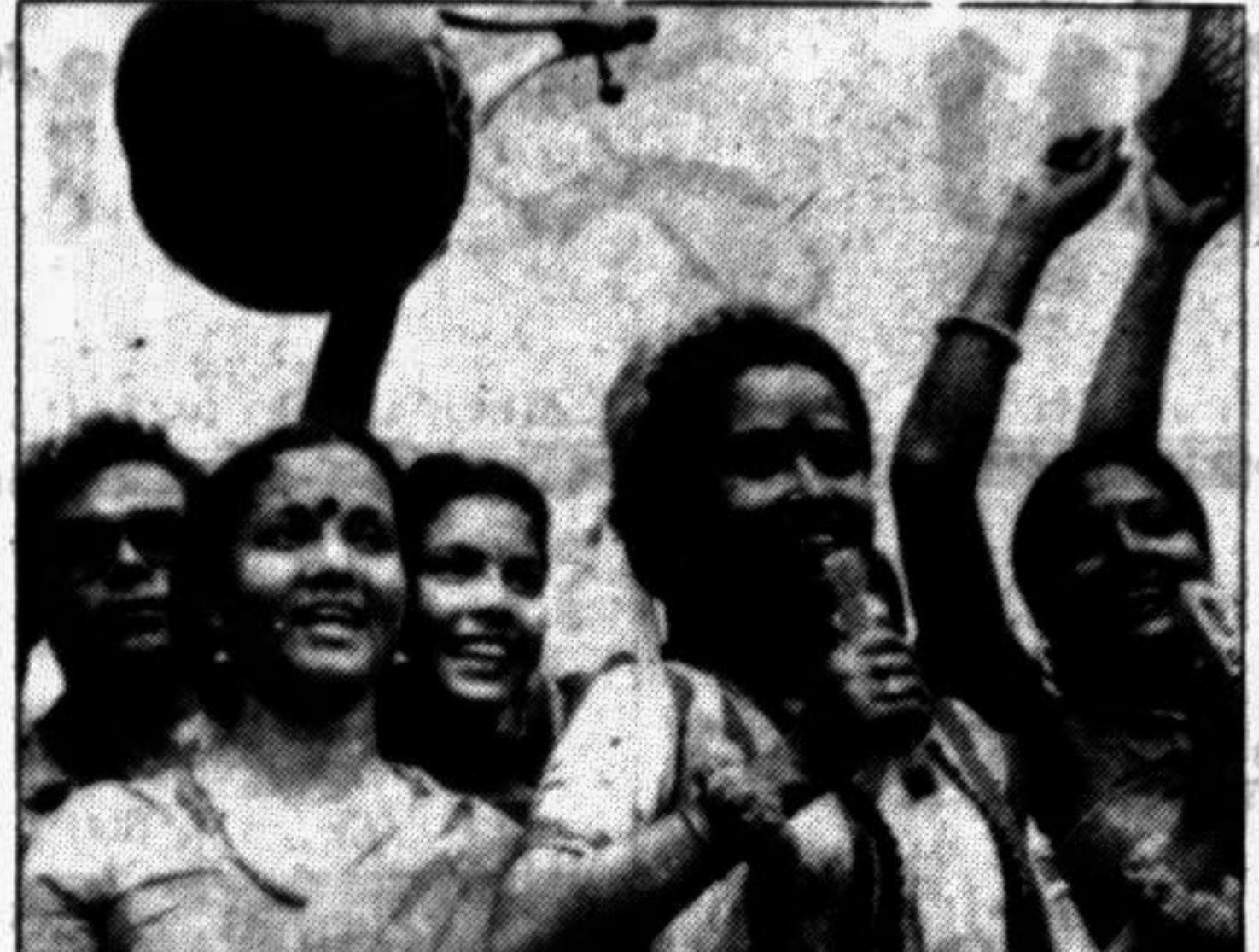
Dancers in traditional attire, displaying folk musical instruments paraded the city to mark the International Dance Day yesterday.

উপ-রেজিস্ট্রার (শিক্ষা) ঢাকা বিশ্ববিদ্যালয়।