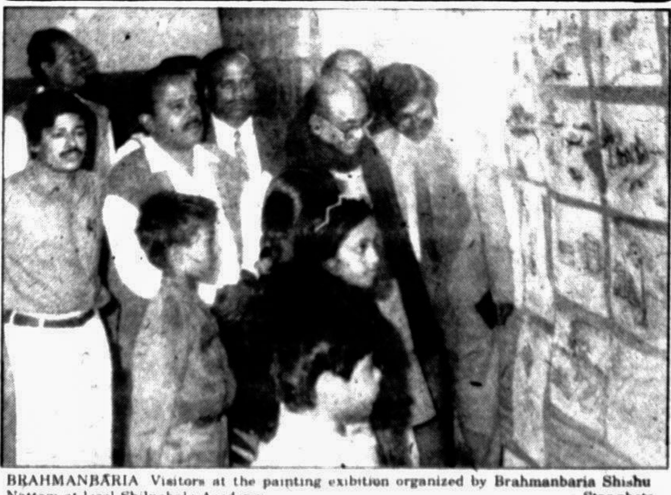
BRAHMANBARIA Visitors at the painting exhibition organized by Brahmanbaria Shishu Nattom at local Shilpakala Academy

teacher of the school informed, her school starts at 8 in the morning and ends at 11 am. She also informed that all these children did not go to school before. A good number of students work here and there to meet their daily requirements as most of them come from poorest families.