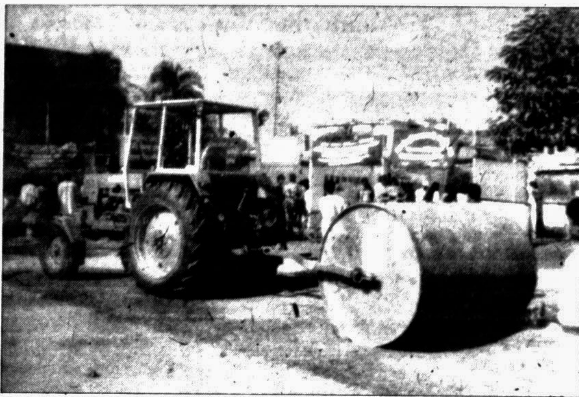
The sand filled portable roller put on display at the DC office in Jhenidah. The portable roller was designed by the engineers of Local Government Engineering Department, Jhenidah.