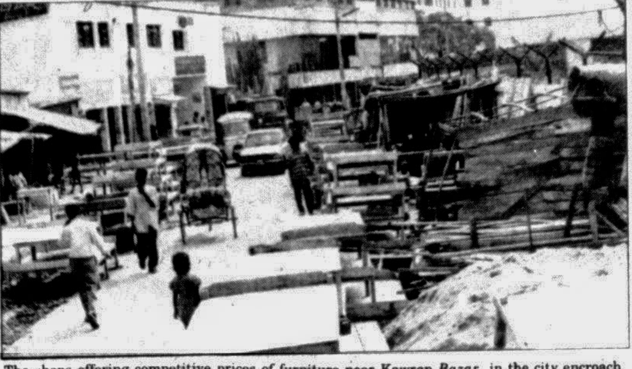
The shops offering competitive prices of furniture near Kawran Bazar in the city encroach the street creating hardship to pedestrians.

গণপ্রজাতন্ত্রী বাংলাদেশ সরকার বন অধিদপ্তর বন ভবন, মহাখালী সড়ক, মহাখালী, ঢাকা-১২১২ সংক্ষিপ্ত দরপত্র বিজ্ঞপ্তি অত্র দপ্তরের দরপত্র বিজ্ঞপ্তি নং-২২, তারিখ ১৮-১২-৯৪ইং মূলে বন ভবন, মহাখালীতে স্থাপিত জার্মানীর হাছান হাভের নিফটটির জন্য সংক্ষিপ্ত দরপত্রের তফসিলে বর্ণিত নতুন যন্ত্রাংশ সরবরাহের উদ্দেশ্যে হাছান কোম্পানীর আমদানিকারক/এজেন্ট/অনুমোদিত ডিলার/সরবরাহকারী ঠিকানারূপে নিম্নে উল্লিখিত সীলমোহরকৃত খামে দরপত্র আহ্বান করা যাইতেছে। দরপত্র অত্র দপ্তরে ০৯ নং কক্ষে রক্ষিত টেন্ডার বাজে আগামী ৭-১-৯৫ইং তারিখ বেলা ১২.০০ ঘটিকার মধ্যে দাখিল করিতে হইবে। প্রাপ্ত দরপত্রগুলি এদিনই বেলা ১২.৩০ ঘটিকার সময় খোলা হইবে। দরপত্রাদাওণ ইচ্ছা করিলে দরপত্র খোলার সময় উপস্থিত থাকিতে পারিবেন। মূল দরপত্রসহ দরপত্রের শর্তাবলী ও এতদসম্পর্কীয় বিস্তারিত বিবরণ প্রধান বন সন্ত্রক্ষক, বাংলাদেশ, ঢাকার কার্যালয়, বন ভবন, মহাখালী হইতে ৫-১-৯৫ইং তারিখ পর্যন্ত (সক্রেতার ও অন্যান্য ছুটির দিন ব্যতীত) অফিস চলাকালীন সময়ে জানিতে ও দেখিতে পারা যাইবে। সৈয়দ আলী আহমদ সহকারী প্রধান বন সন্ত্রক্ষক প্রধান বন সন্ত্রক্ষকের পক্ষে বাংলাদেশ DFP-13988-21/12 G-2052