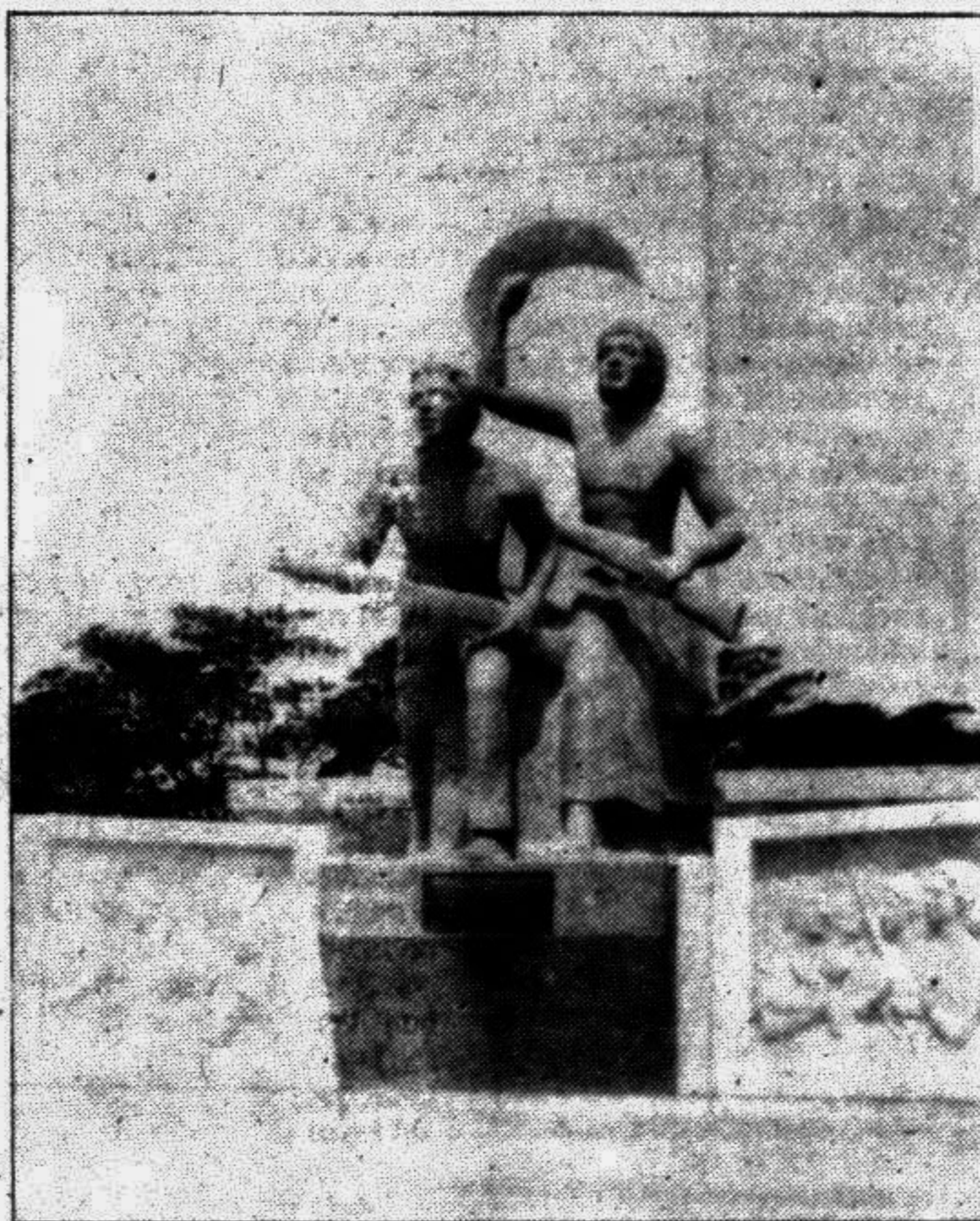
SABASH BANGLADESH. A monument erected in memory of the Freedom Fighters inside the Rajshahi University Campus.