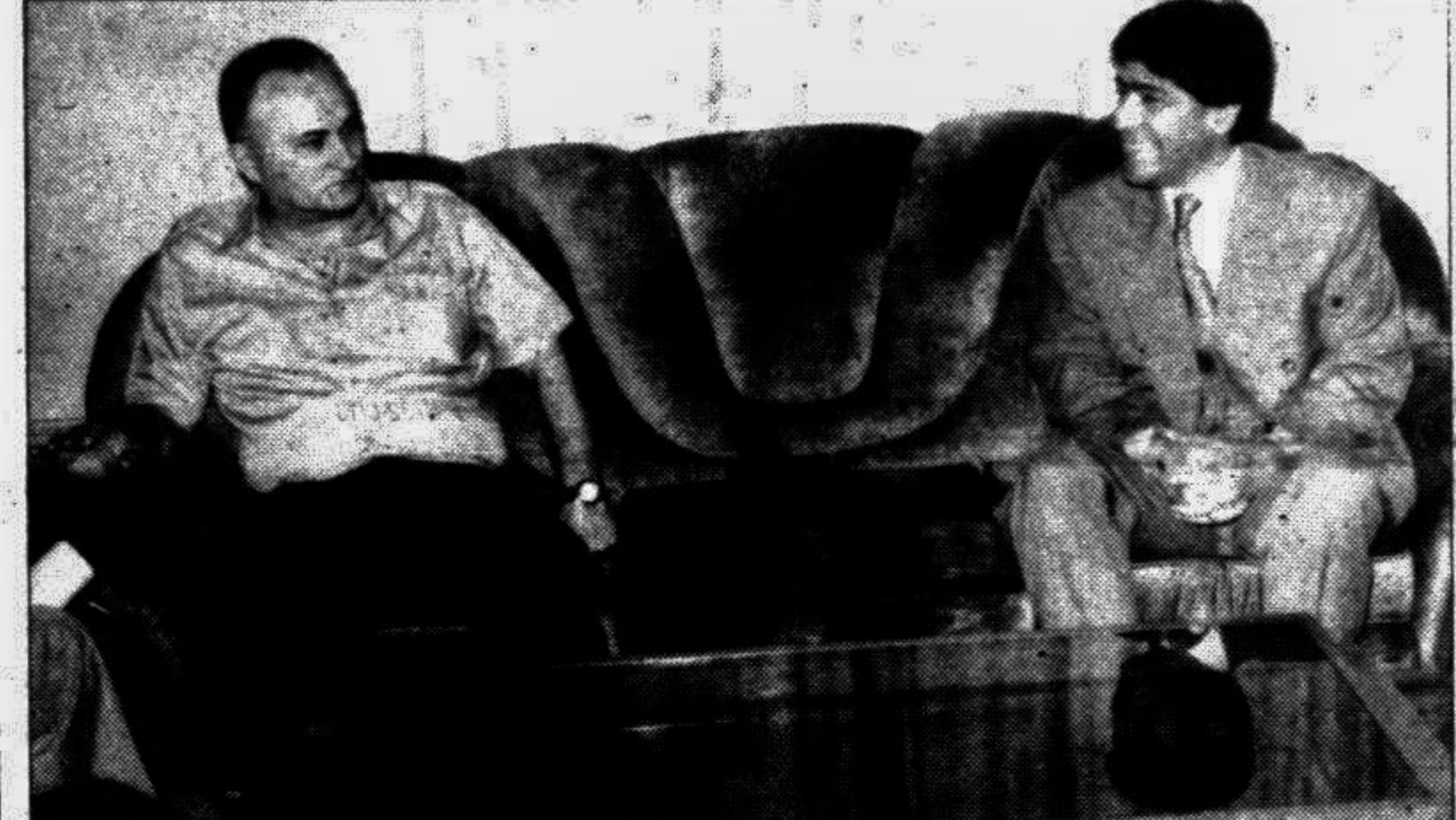
The leader of the 5-member trade delegation of Russian Federation, Deputy Minister for Machine Building Industries Alexandrov V, seen talking to State Minister for Industries Lutfar Rahman Khan while called on the latter at his office in the city yesterday.

Art exhibit: A 8-day art exhibition of elderly artist Zindu Prava Devi will be inaugurated. Her works on different medium will be remain open for all till October 22 from 3pm to 8pm. Venue: Jojon Contemporary Art Gallery. Time: 6:30pm.