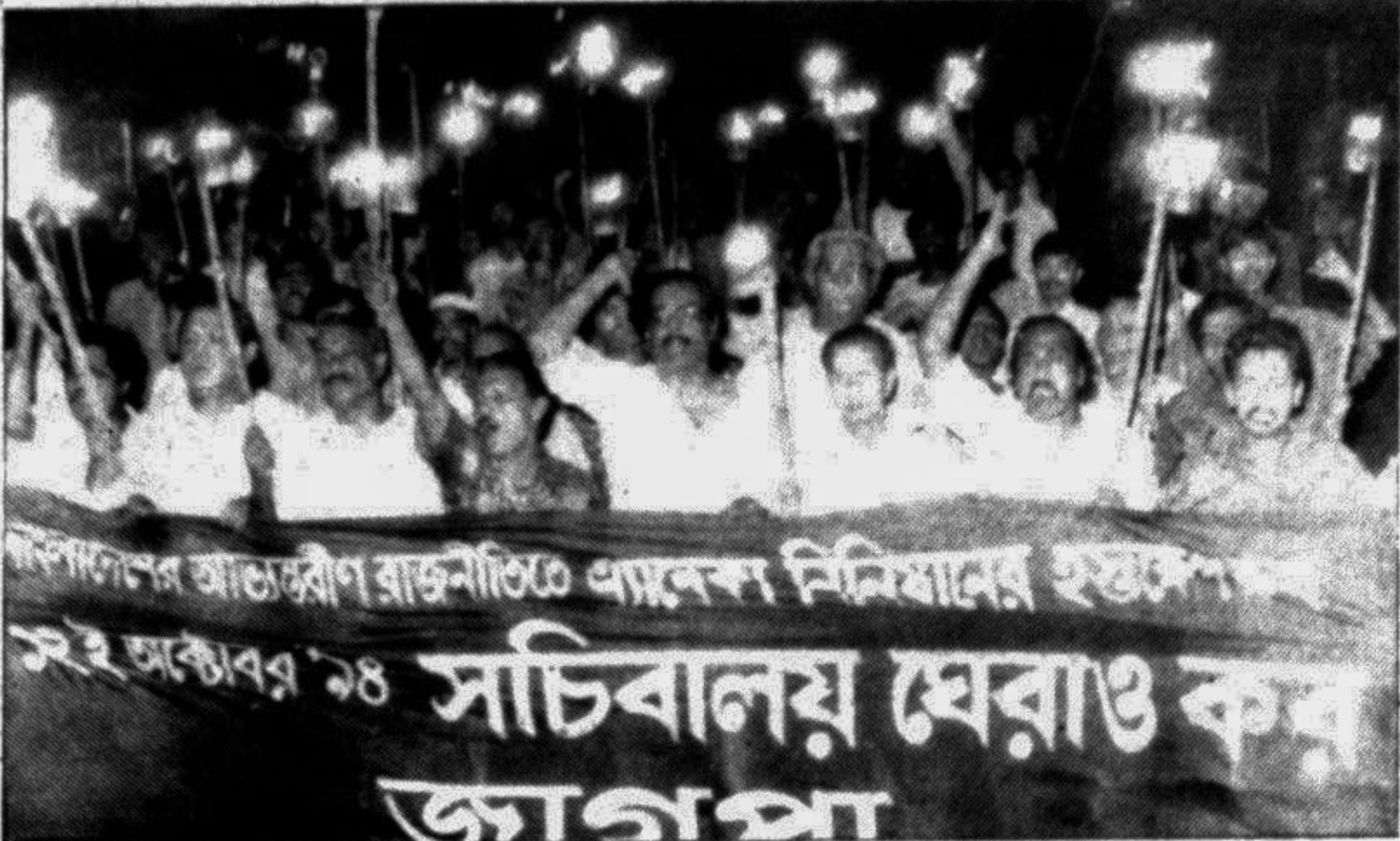
The Jatiya Ganotantrik Party (JAGPA) brought out a torch procession in the city yesterday in support of today's Secretariat gherao programme.