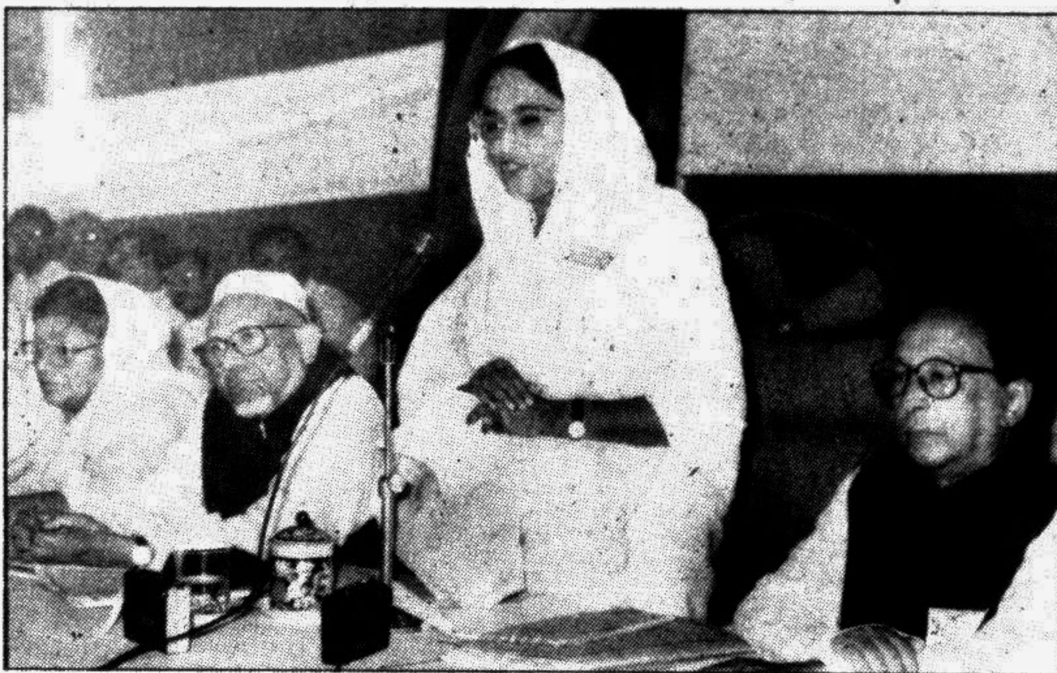
Awami League chief and leader of the Opposition in Parliament addressing an extended meeting of her party at the Minto Road official residence in the city yesterday.