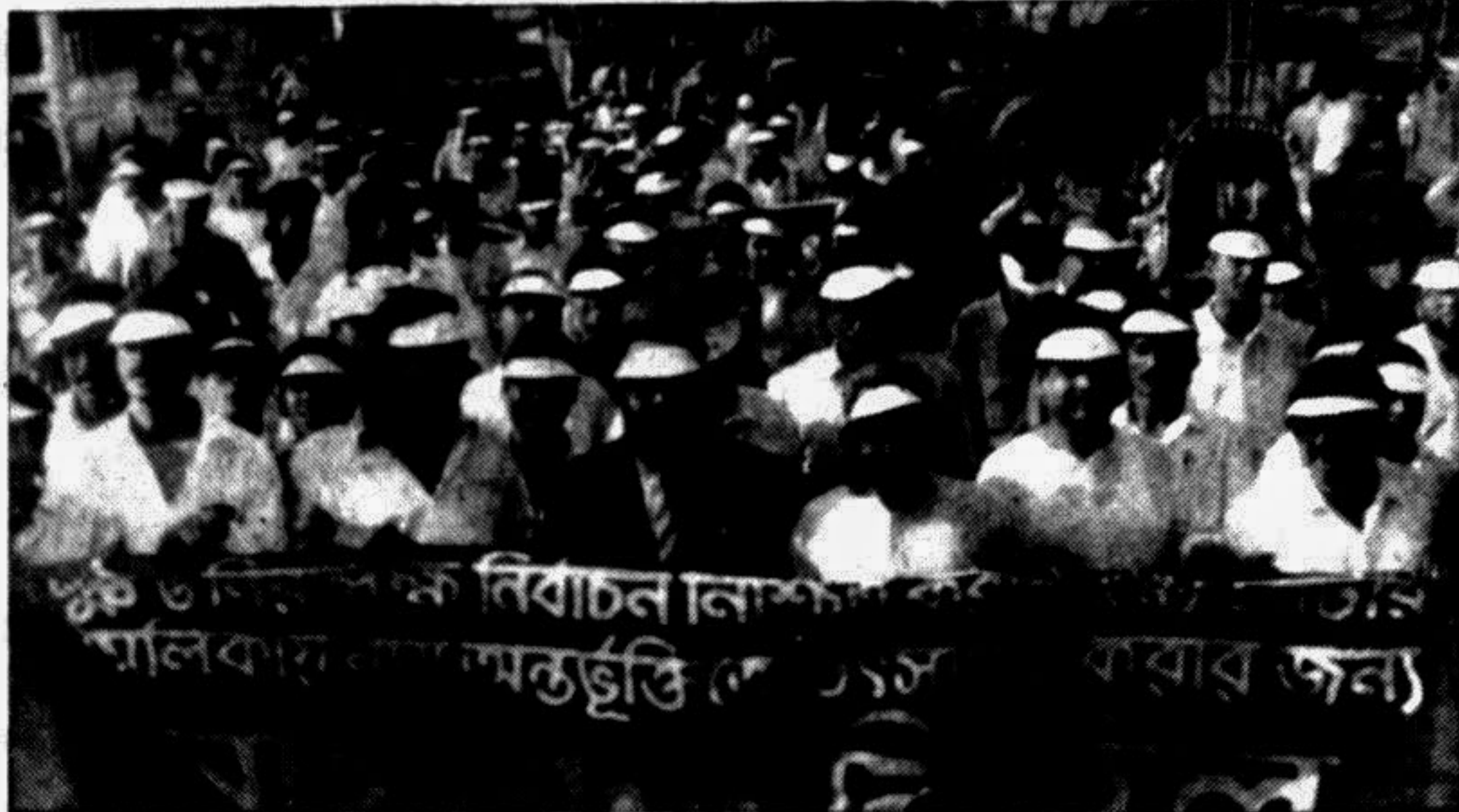
Chief Election Commissioner Justice Abdur Rouf leading a citizens' march at Tongi yesterday to encourage the local people to take an active part in the voters' registration process for the 'model polls' to be held at Tongi Municipality soon.