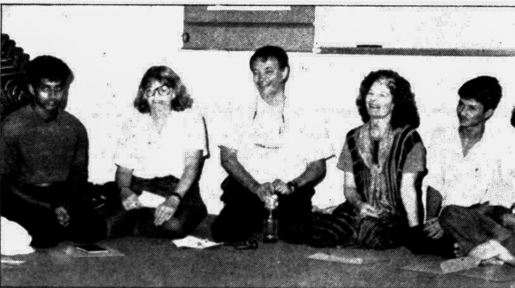
Members of the 'Artistes Repertory Theatre' conducting a theatre workshop at the USIS auditorium in the city on Wednesday.