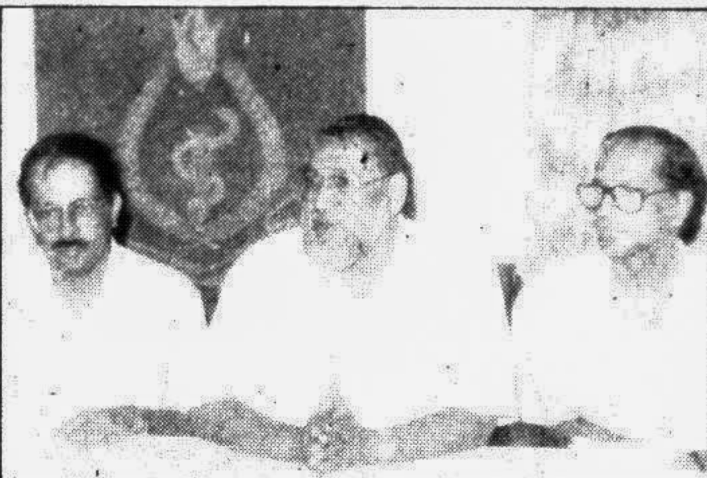
The Bangladesh Medical Association held a press conference at the BMA Bhaban in the city yesterday on the occasion of 7th Asian Conference on Diarrhoeal Diseases scheduled for tomorrow.

Tomorrow I will go to the German embassy. I expect there will not be the usual queue, holding me up for some twenty minutes. Hartals? Hurray!