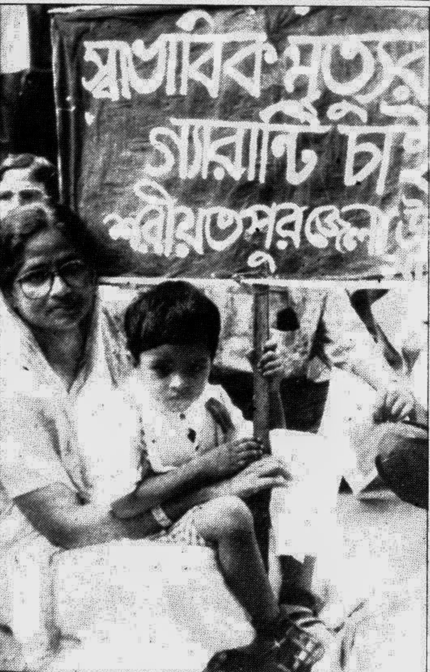
The Shariatpur District Development Association in Dhaka brought out a rally in the city yesterday to mourn the death of passengers of the MV Dinar-2 at Chandpur on August 20.

পল্লী বিদ্যুতায়ন বোর্ড MURAL ELECTRIFICATION BOARD DPP-3679-4/9