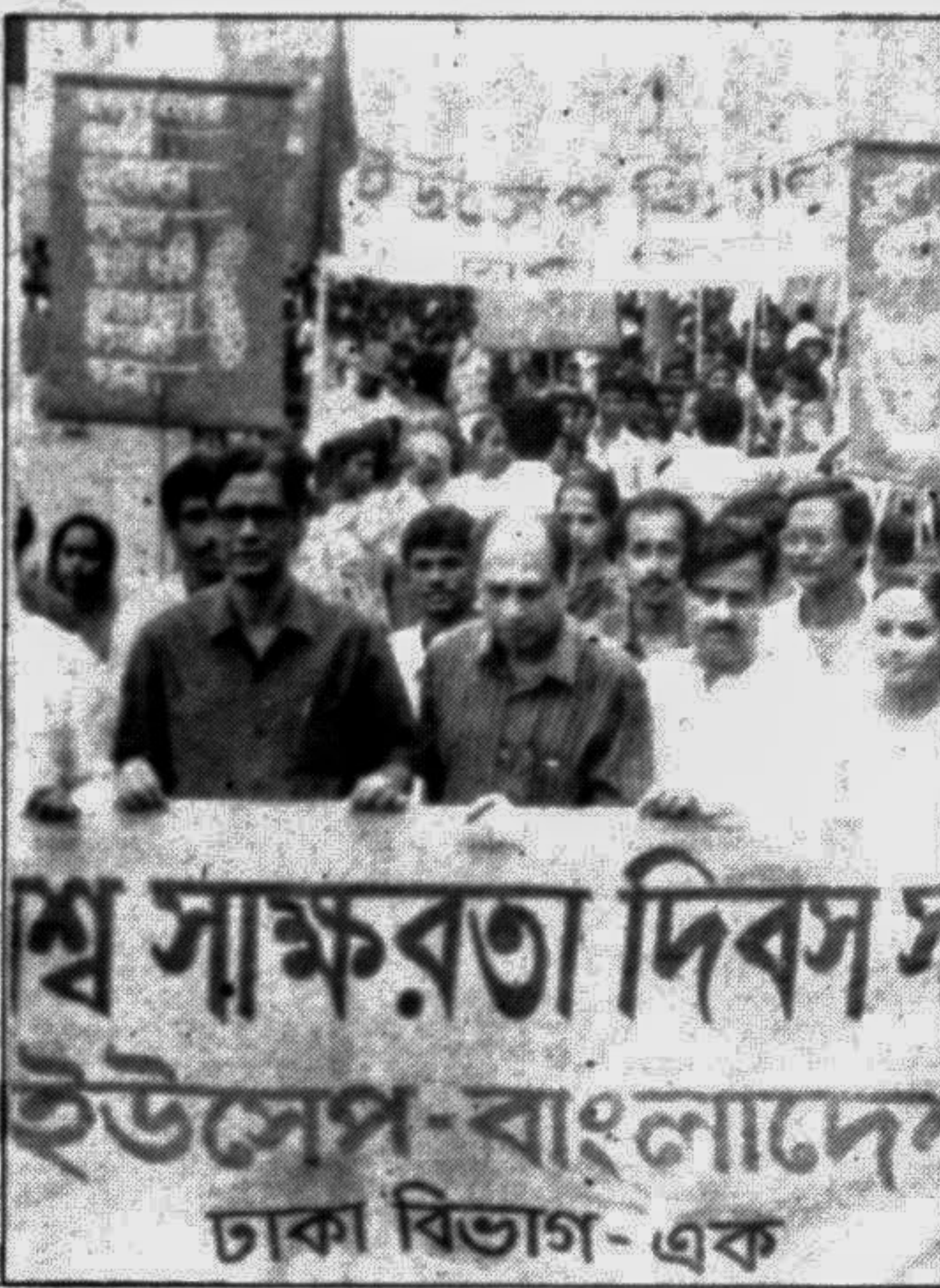
Dhaka City Corporation Mayor Mohammad Hanif (L) at a rally in the city yesterday to mark the International Literacy Day. The UCEP, Dhaka organised the rally.

The teachers and students of the department of economics, Jahangirnagar University at a meeting yesterday condoled the death of Prof Mirza Mozammel Haq of the department who died last week, reports UNB.