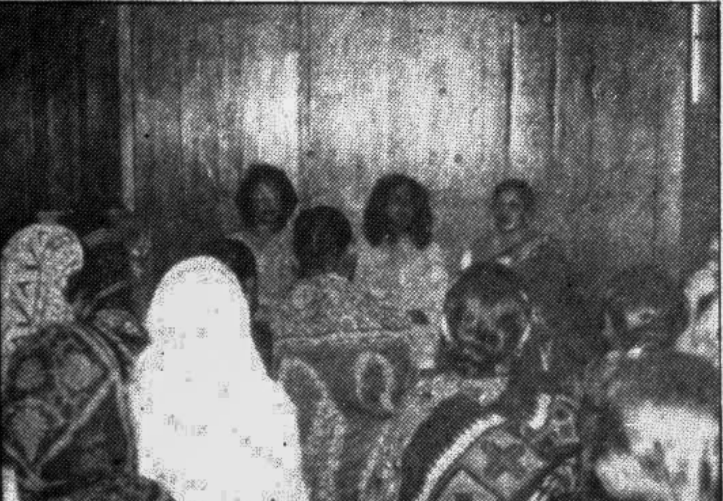
The Zonta Club of Dhaka III, a charitable organisation, recently held a discussion in the city as part of their fortnight-long programmes on the occasion of the countrywide Mother and Child Health Fortnight '94 which began September 1.