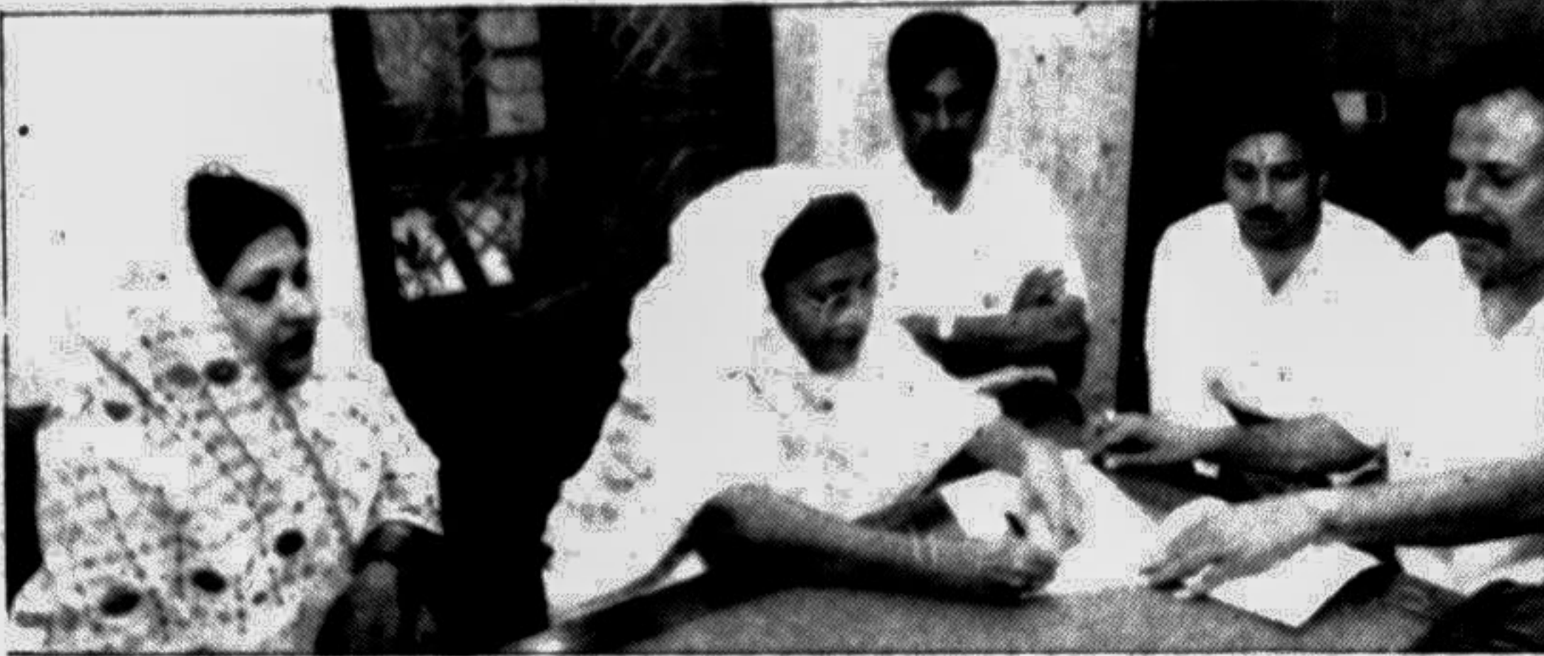
Sheikh Hasina and Sheikh Rehana, daughters of Bangabandhu Sheikh Mujibur Rahman, yesterday signed a deed transferring the house at Road No 32, Dhanmandi to the Bangabandhu Sheikh Mujibur Rahman Memorial Trust - the caretaker of the Bangabandhu Sheikh Mujibur Rahman Memorial Museum.