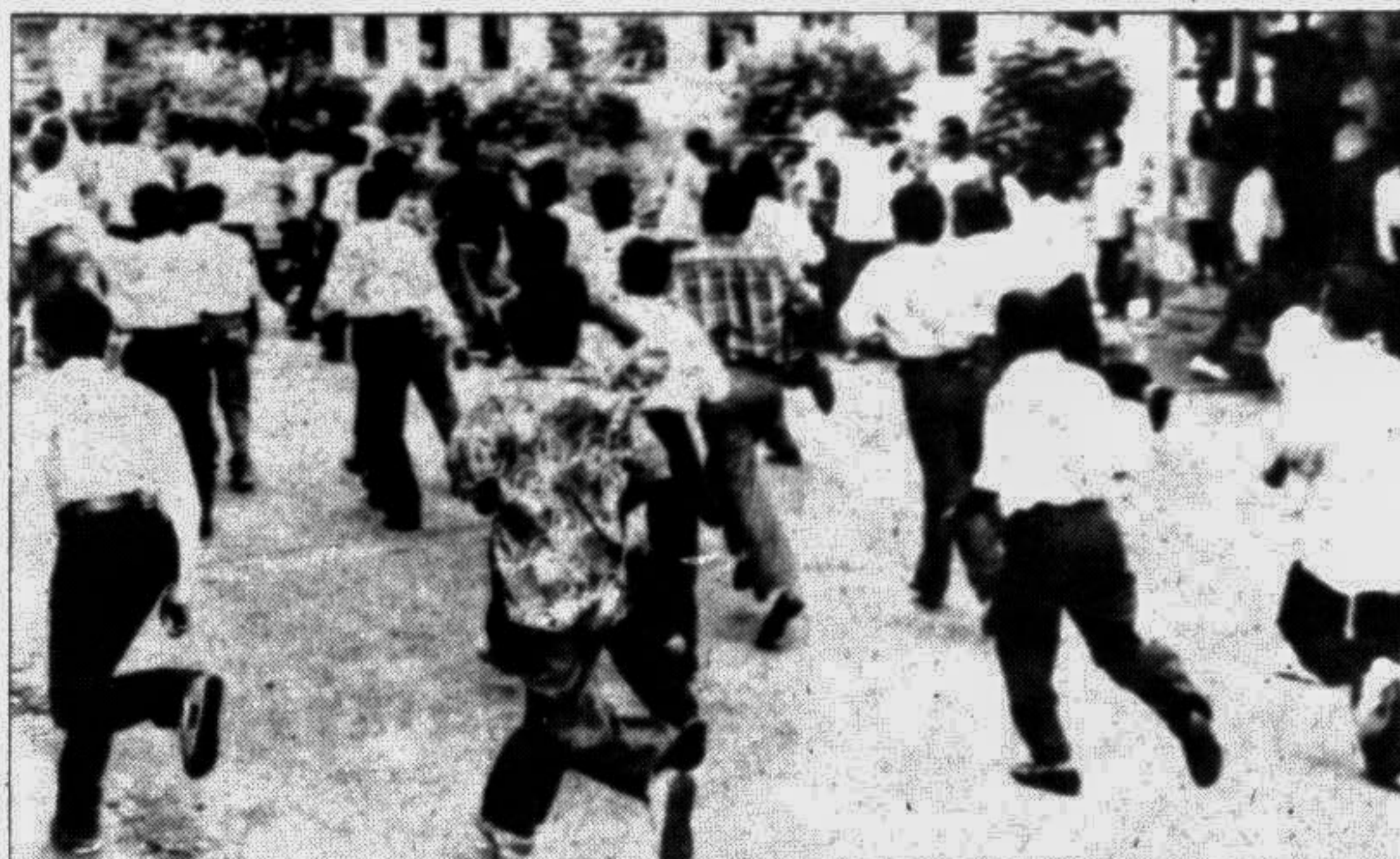
Students running for their lives as the rival JCD and BCL activists clashed on the campus.