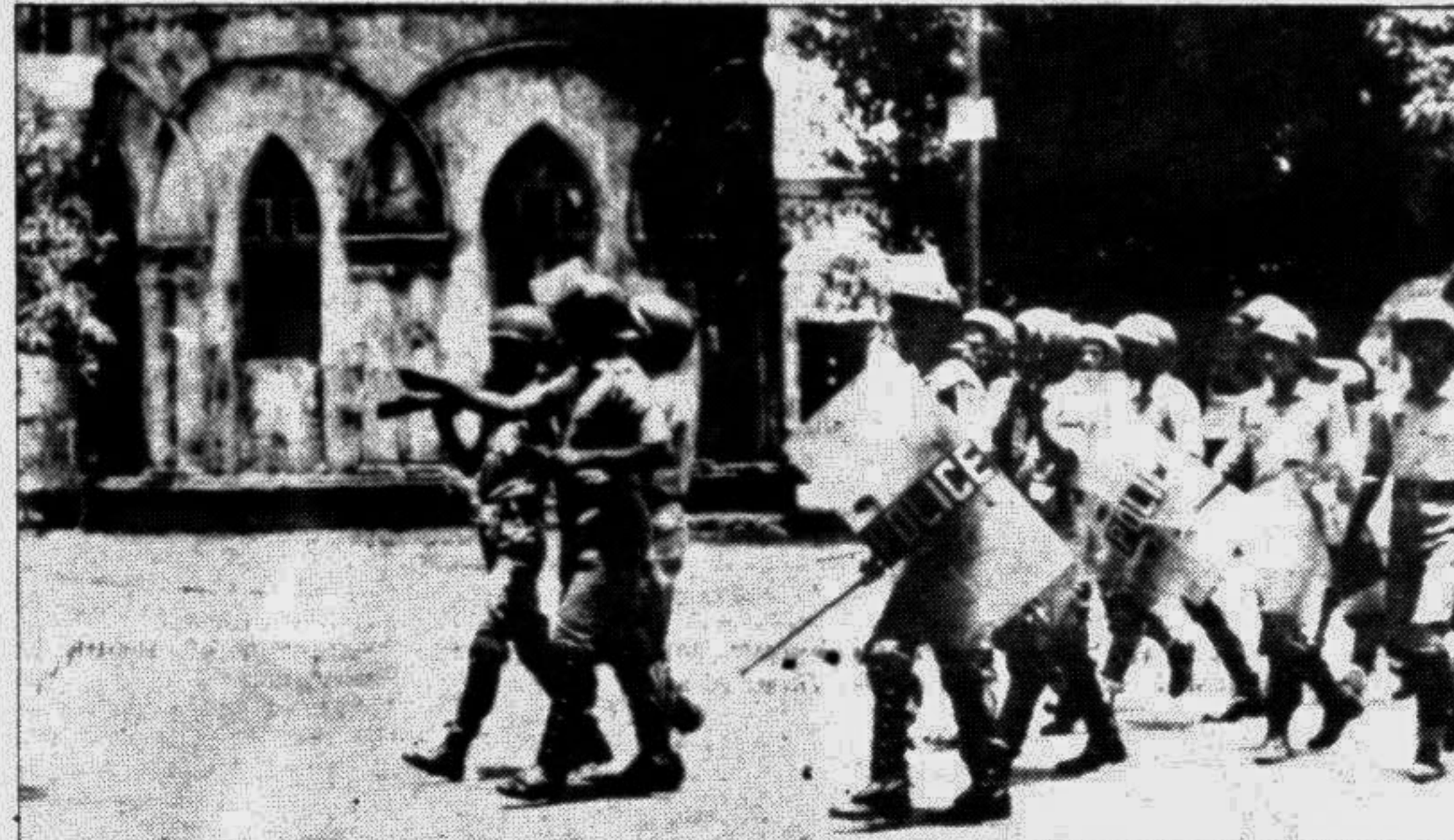
Riot police entering the Arts Faculty building.