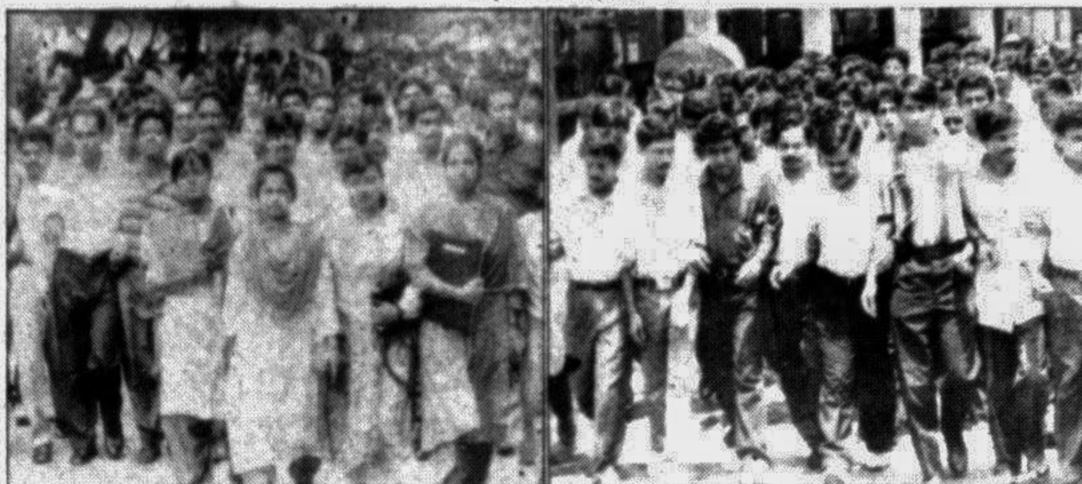
Supporters of the pro-BNP Chhatra Dal (left) and the pro-AL Chhatra League (right) brought out processions at the Arts Faculty.