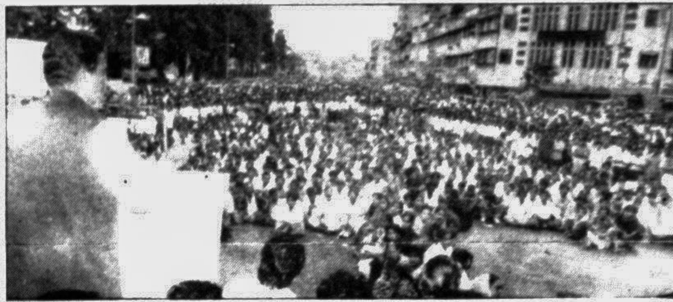
Abdur Razzak, MP, addressing a meeting of the Nirmul Samannaya Committee at the Bangabandhu Avenue in the city yesterday.

The experts said that extension planning should be on long-term basis. Massive use of mass media such as radio, TV, exhibition, fair, cinema slides and short films.