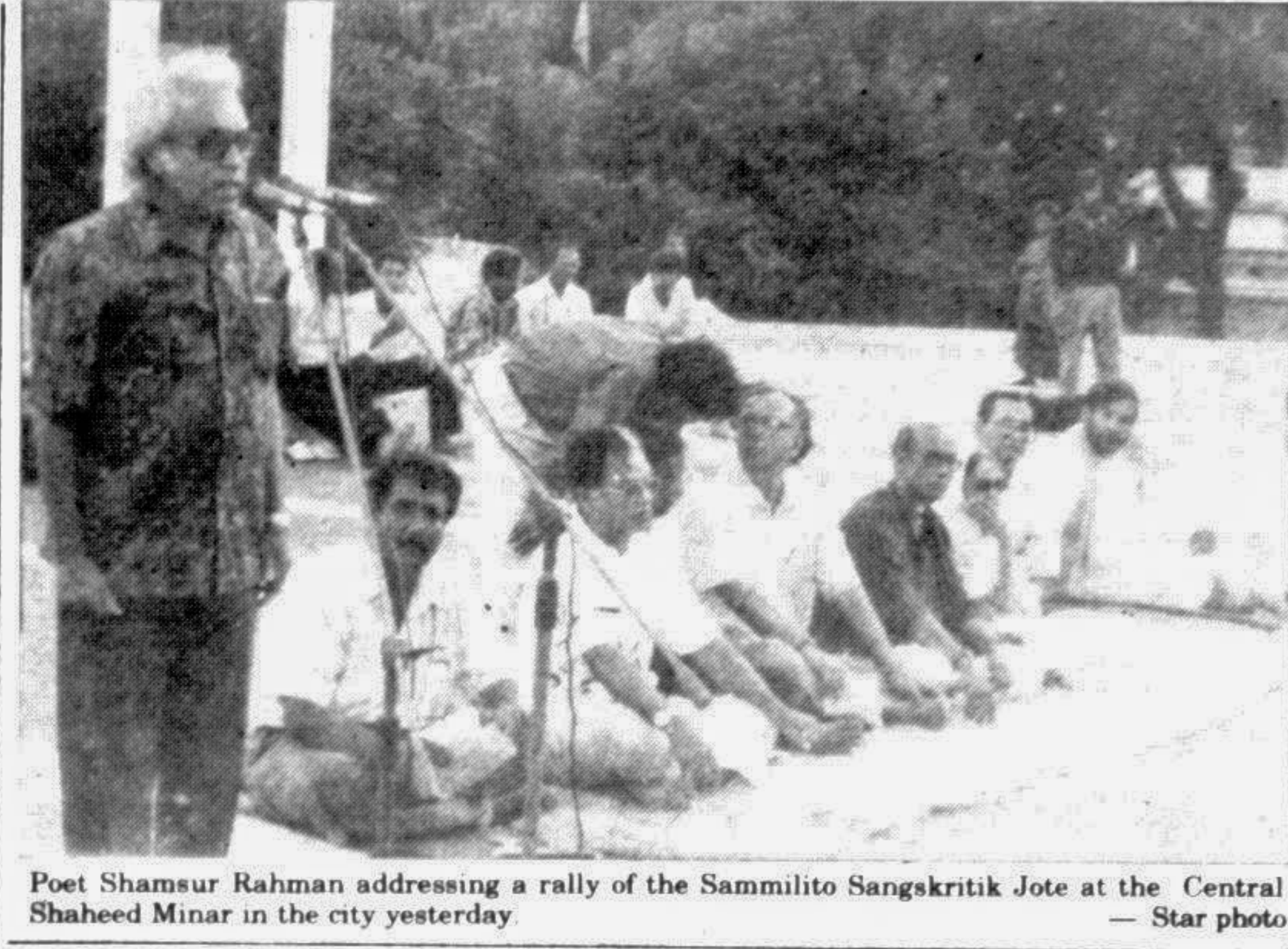
Poet Shamsur Rahman addressing a rally of the Sammitito Sangskritik Jote at the Central Shaheed Minar in the city yesterday.

Sonali Bank gives Tk 2.88 cr loan to small industries In view of generating employment and alleviating poverty of the marginal people, the Sonali Bank sanctioned Tk two crore and 88 lakh to 1187 people across the country in one year under the Special Investment Programme, says a press release. The loan was sanctioned against small and cottage industries through the bank's 83 branches. The small industries which got priority were — light engineering workshop, clinic/nursing home, rickshaw and auto-rickshaw workshop, small bakery, radio, TV and refrigerator workshop, tailoring shop and other small income generating industries.