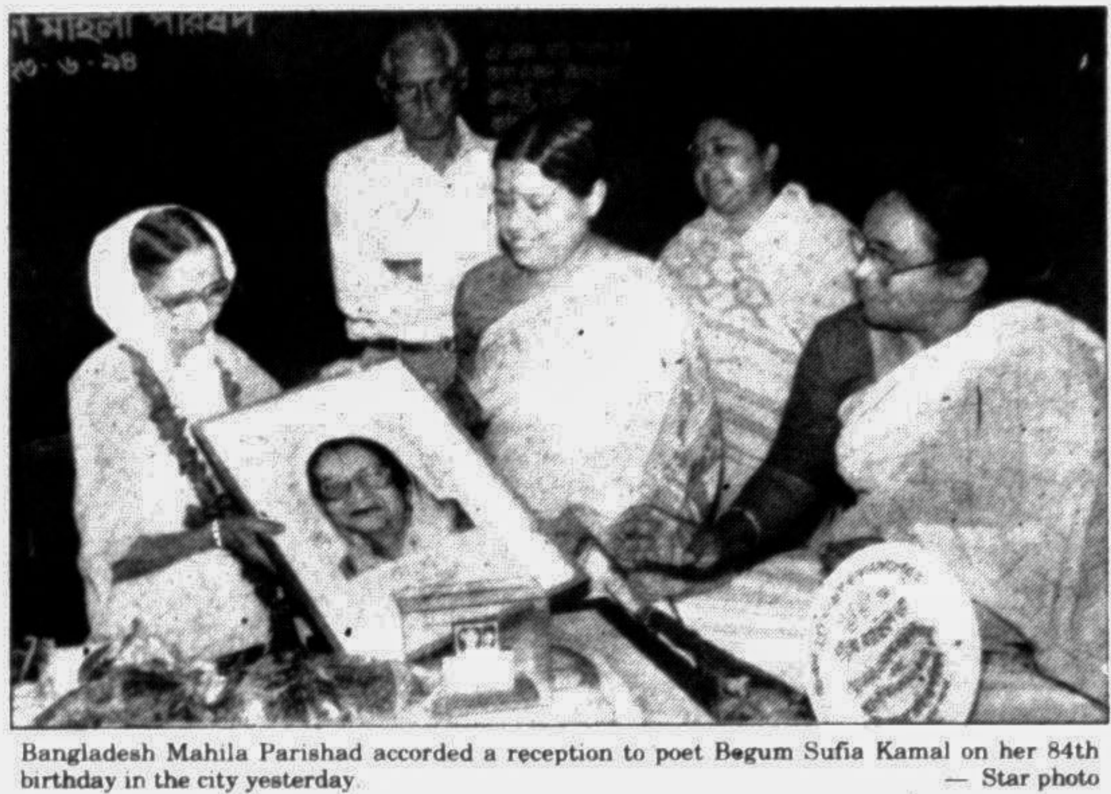
Bangladesh Mahila Parishad accorded a reception to poet Begum Sufia Kamal on her 84th birthday in the city yesterday.