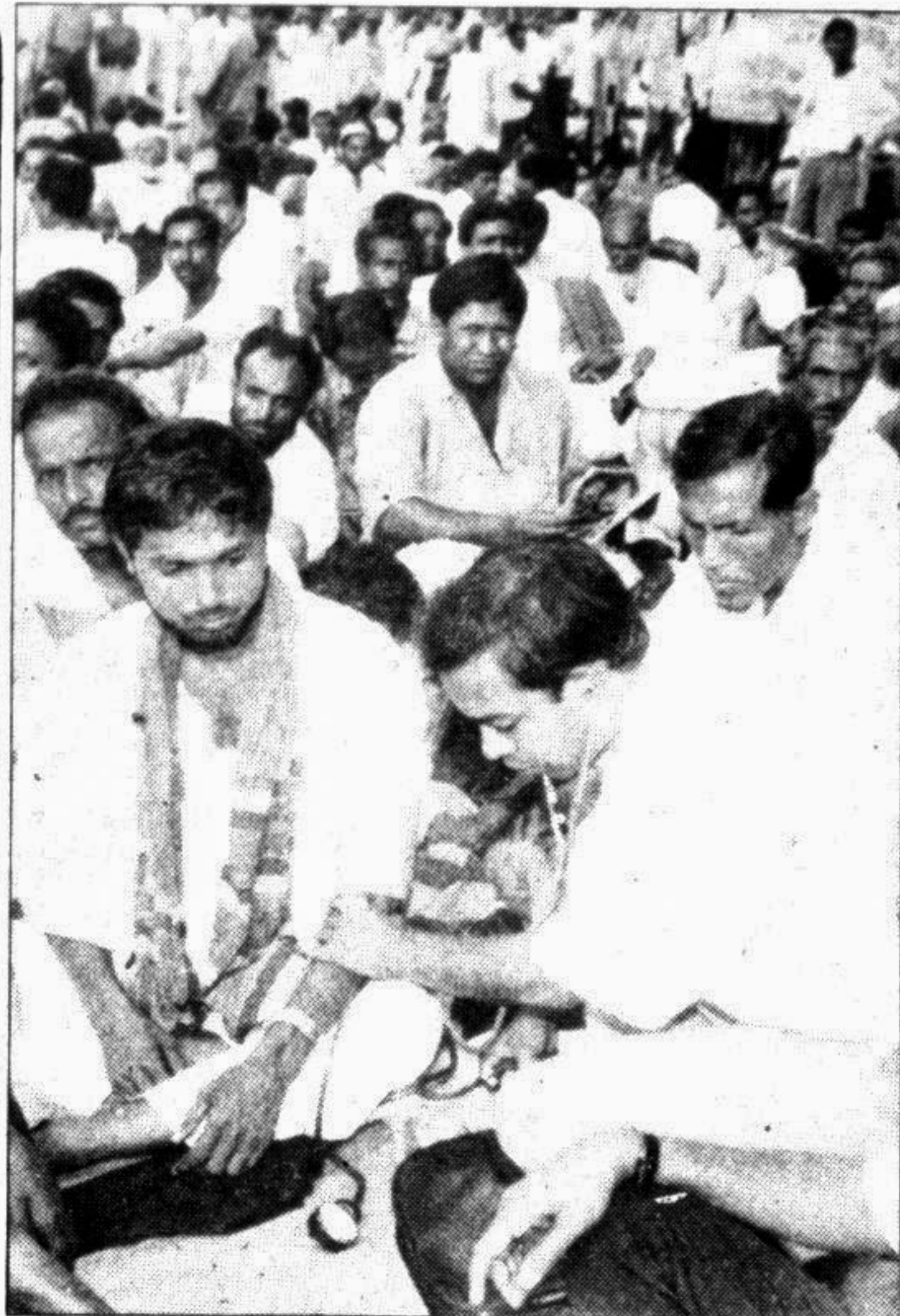
Doctor examining one of the teachers who are on a hunger strike in front of the National Press Club in the city yesterday.

The patient's wife, recounts, "At times I thought I'd have a heart attack because of the things that I kept on hearing and seeing and if I'd been weaker than I am, I would have too." This is one representative — and true — story. It shows how mindless and cruel the system has become. Can we expect it to be responsible and dutiful if not humane?