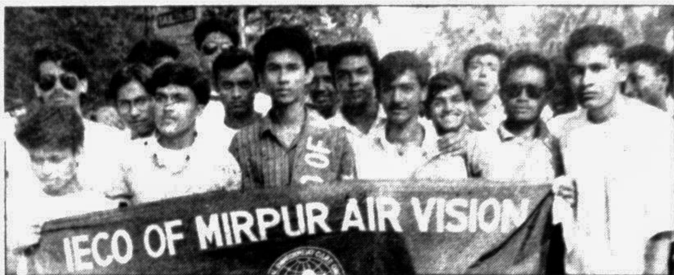
A youth rally in the city marking the World Environment Day yesterday.