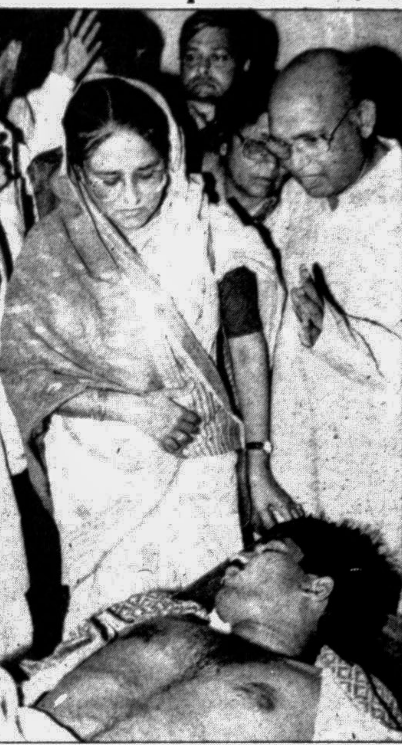
Awami League chief and Leader of the Opposition in Parliament Sheikh Hasina visited Dhaka Medical College Hospital (DMCH) to see for herself the body of the victim who was killed in city's Kaptan Bazar firing incident yesterday.