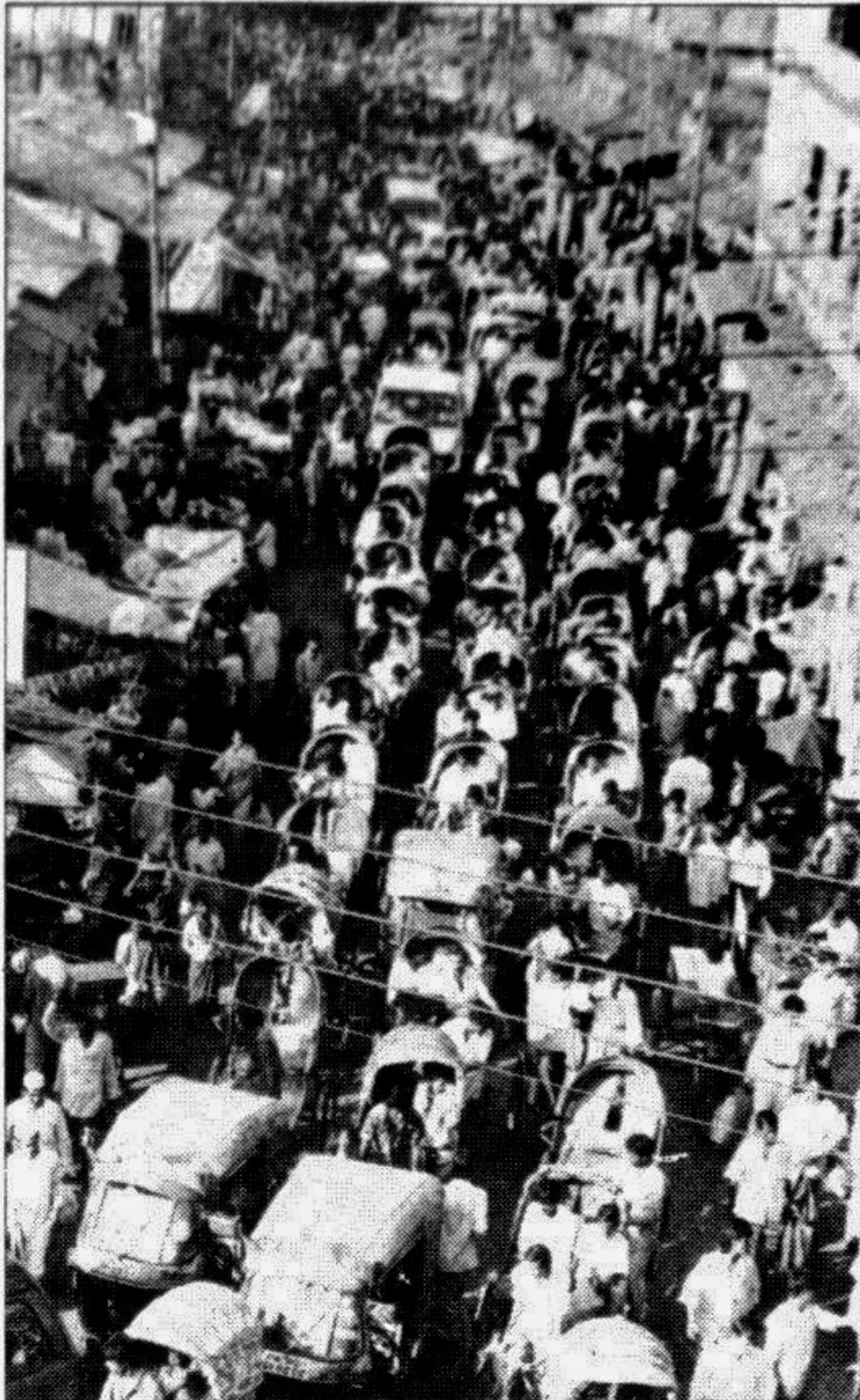
The Sadarghat Road which leads to the city's launch terminal is jammed with hundreds of rickshaws. Illegal road-side shops turn the narrow street even narrower. The picture was taken yesterday.