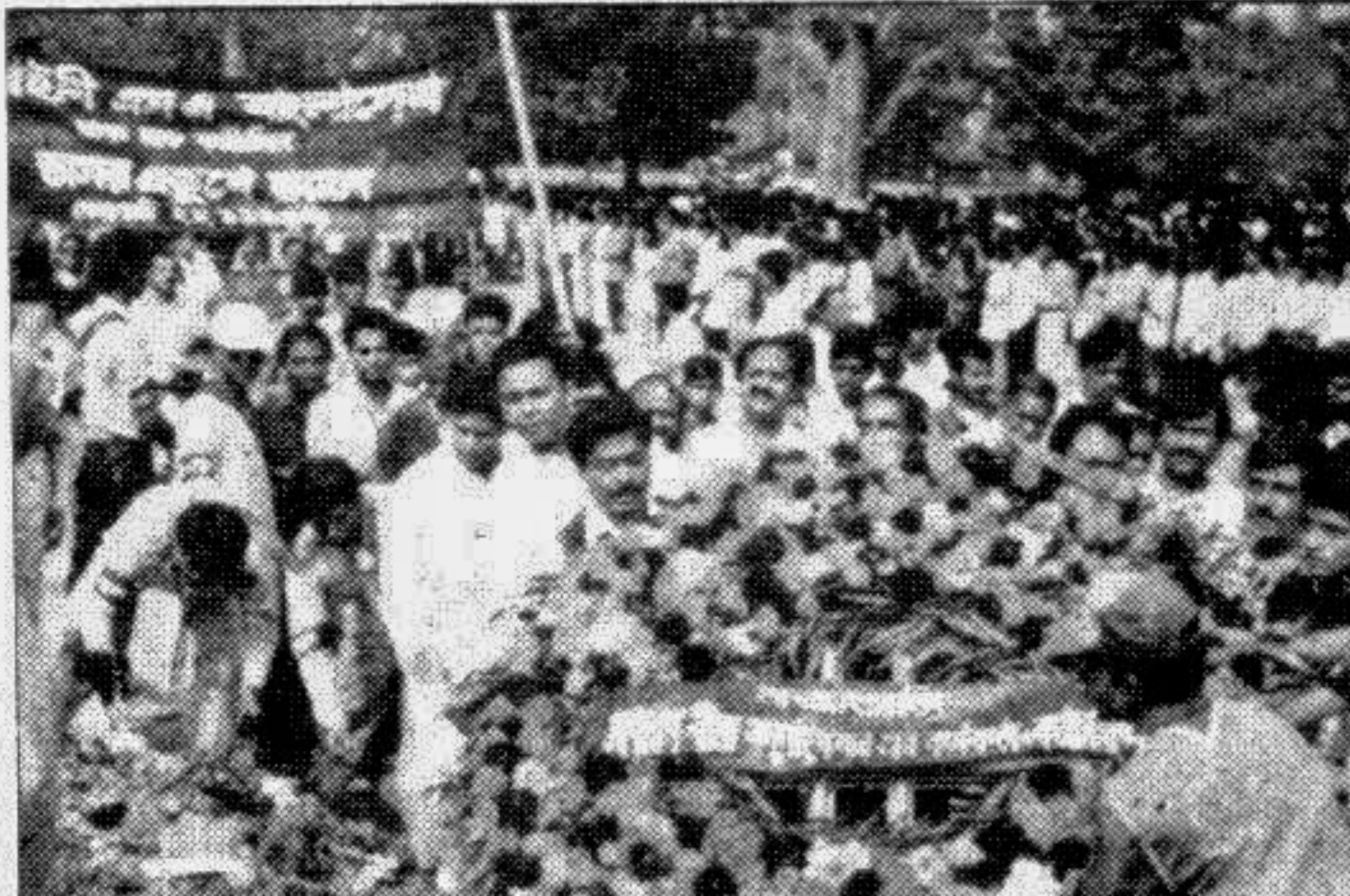
Employees of the Sadharan Bima Corporation placing wreaths at the Central Shaheed Minar Monday.