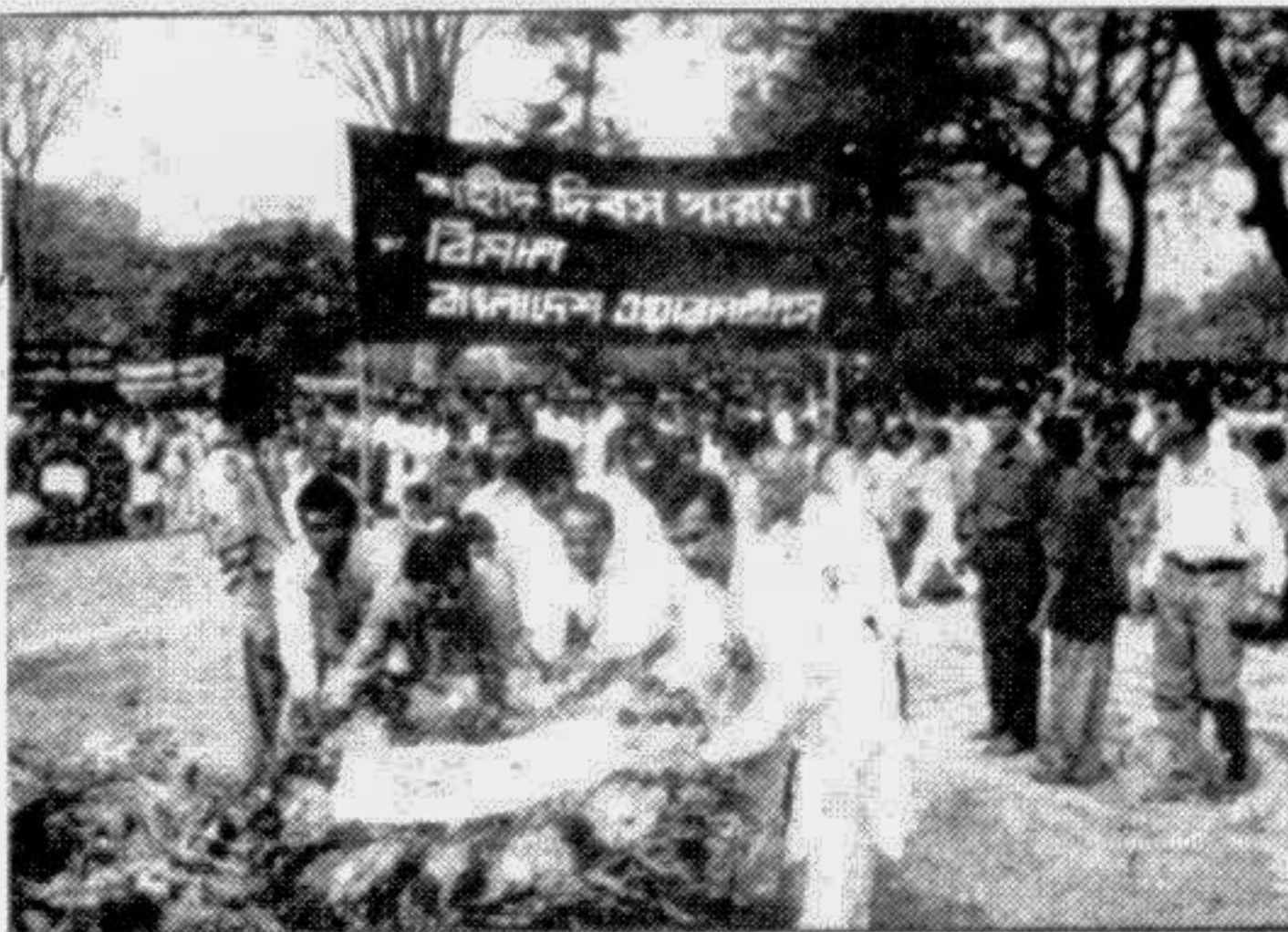
Wreaths being placed at the Central Shaheed Minar on behalf of Biman Bangladesh Airlines Monday in observance of the 42nd anniversary of the historic Language Movement.

গণপ্রজাতন্ত্রী বাংলাদেশ সরকার অধ্যক্ষের কার্যালয় কোটালীপাড়া শেখ মুফকর রহমান আদর্শ সরকারী কলেজ কোটালীপাড়া, পোপালপাড়া। দরপত্র বিজ্ঞপ্তি নং-২২০/৯৪ তারিখঃ ০৮-২-১৯৯৪ ইং / ২৬-১০-১৪০০ বাং