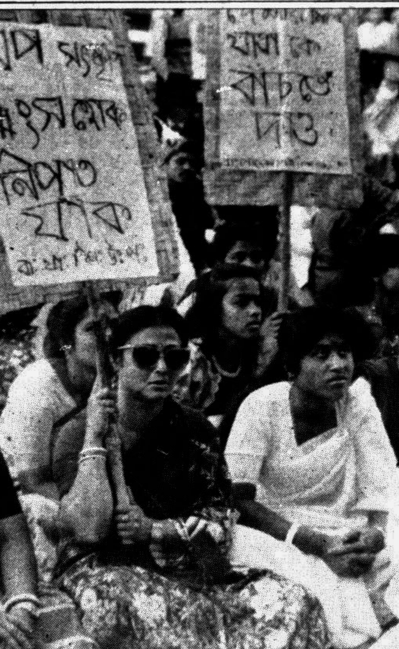
The Bangladesh Jatra Silpa Unnayan Parishad staged a rally in front of the Jatiya Press Club yesterday with placards reading: Save the indigenous theatre from Jatra.