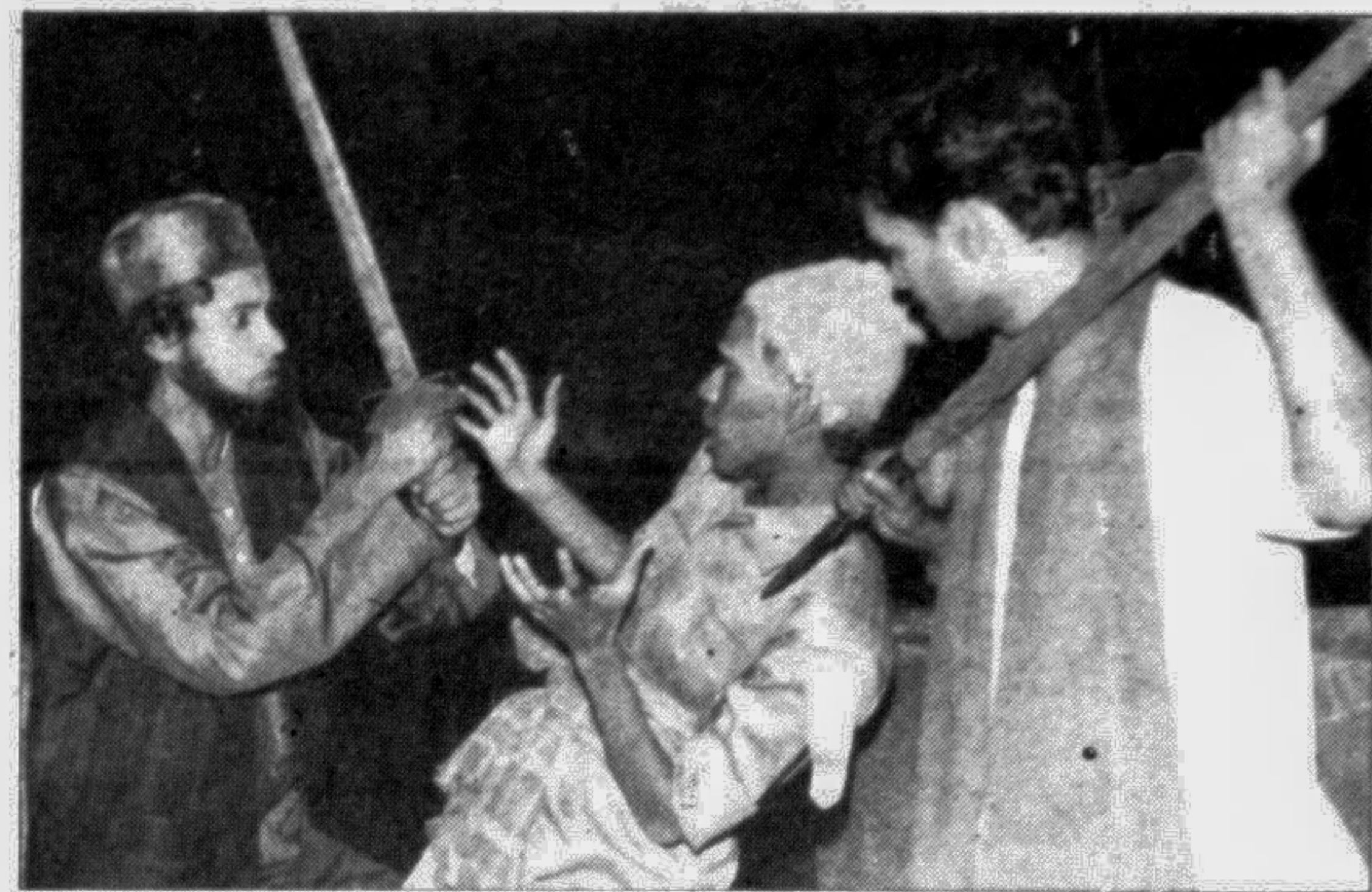
A scene from the play Indara by the Artanad group, staged at the Central Shaheed Minar yesterday on the 4th day of the week-long Street Drama Festival organised by the cultural organisation Samaya.

The book narrates the development of blindness programmes and livelihood of the visually impaired from 1957—when the first project for the blind was established—to the present. The accomplishments of the various governmental and non-governmental organizations, in the prevention of nutritional blindness and Community Based Rehabilitation (CBR), is presented in the book.