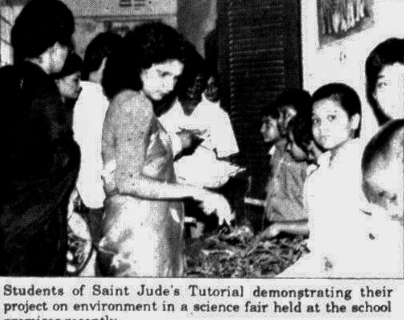
Students of Saint Jude's Tutorial demonstrating their project on environment in a science fair held at the school premises recently.