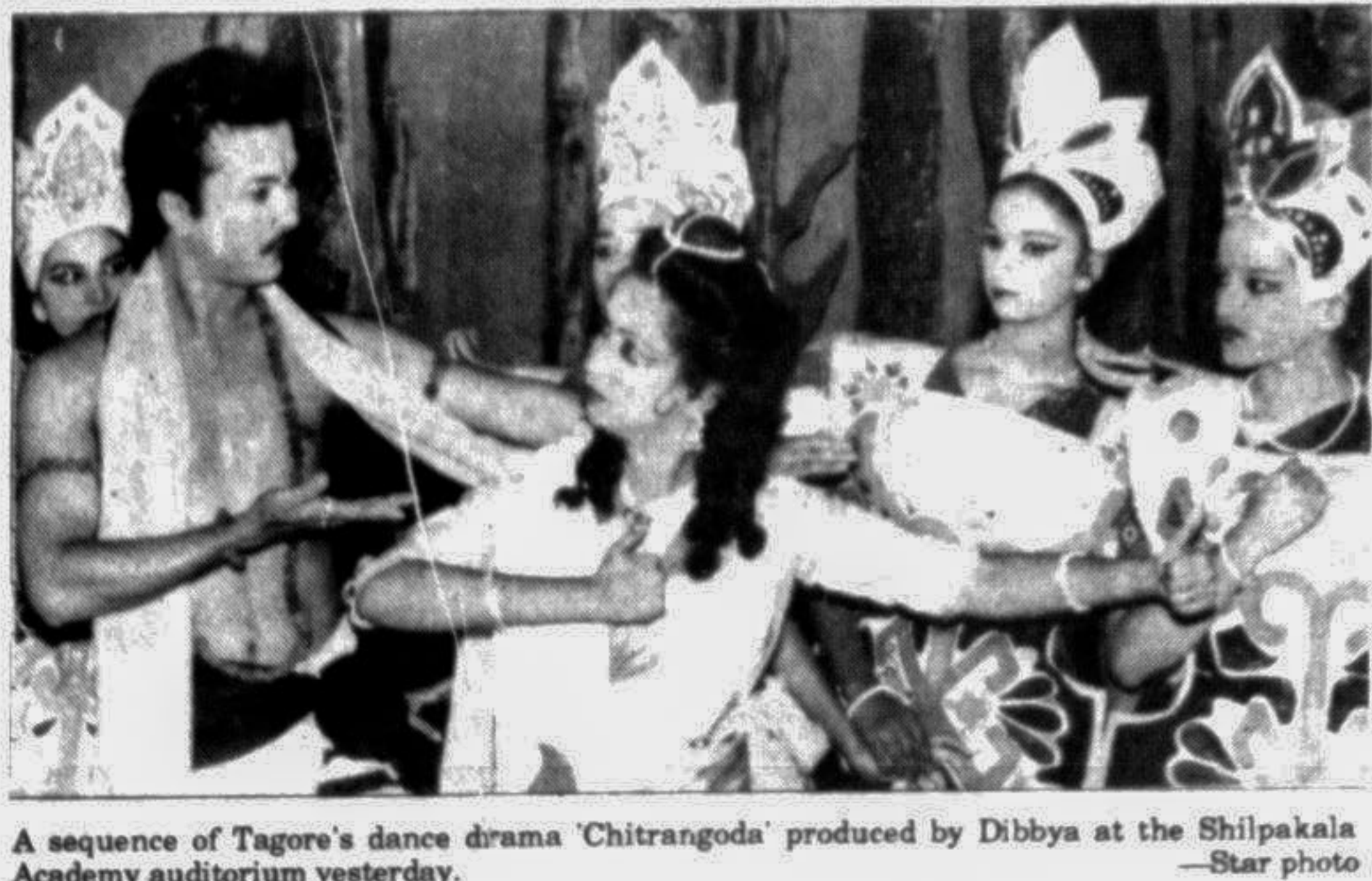
A sequence of Tagore's dance drama 'Chitrangoda' produced by Dibhya at the Shilpakala Academy auditorium yesterday.

গণপ্রজাতন্ত্রী বাংলাদেশ সরকার অতিরিক্ত পরিচালকের কার্যালয় গবেষণা, প্রশিক্ষণ ও মূল্যায়ন পশু সম্পদ গবেষণা প্রতিষ্ঠান, মহাখালী, ঢাকা-১২১২ পুনঃ দরপত্র বিজ্ঞপ্তি স্মারক নং- শাখা দরপত্র/বা/১/৯০/৫৪১ তারিখ: ৭-৮-৯৩ ১৯৯০-৯১ অর্থ বৎসরের জন্য অতিরিক্ত পরিচালক, পশু সম্পদ গবেষণা প্রতিষ্ঠান, মহাখালী, ঢাকা আওতাধীন বিভিন্ন শাখার জন্য সিভিলিয়ন বসিত পশু, বাসা সরবরাহ করার জন্য পরিচালক পশু সম্পদ অধিদপ্তর এর তালিকাভুক্ত সকল শ্রেণীর টিকাদারের নিকট হইতে সিভিলিয়ন দরপত্র আহ্বান করা হইতেছে। উক্ত দরপত্র আপাতী ১৬-৮-৯৩ ইং তারিখে অত্র দপ্তরের রক্ষিত দরপত্র বাসে, পশু সম্পদ অধিদপ্তরের রক্ষিত দরপত্র বাসে, চীফ ডেপুটি পরিচালক অফিস, ৪৮, কাজী আব্দুল মিন্নির রোড, ঢাকার রক্ষিত দরপত্র বাসে ফেলিতে হইবে এক ঐ দিনই বেলা ২ ঘটিকার টিকাদারের উপস্থিতিতে (যদি কেহ উপস্থিত থাকেন) দরপত্র খোলা হইবে। বিস্তারিত নিম্নলিখিত সফল সিভিলিয়ন ১-৮-৯৩ ইং তারিখ হইতে ১৪-৮-৯৩ ইং তারিখ পর্যন্ত। অত্র দপ্তরের কাগ শাখা, পরিচালক, পশু সম্পদ অধিদপ্তরের ২-এ শাখা, চীফ ডেপুটি পরিচালক অফিস, ৪৮, কাজী আব্দুল মিন্নির রোড, ঢাকা কাগ শাখা হইতে টাঃ ৪০০/০০ (চারপত টাকা মাত্র) এর বিনিময়ে অফিস চলাকালীন সময়ে ক্রয় করিতে হইবে, সিভিলিয়ন চাকা অফিসে যোগাযোগ। দরপত্র খোলার দিন কোন সিভিলিয়ন বিক্রয় করা হইবে না। অতিরিক্ত পরিচালক গবেষণা, প্রশিক্ষণ ও মূল্যায়ন পশু সম্পদ গবেষণা প্রতিষ্ঠান, মহাখালী, ঢাকা-১২১২ DFP(G)12313-7/8 G-1044