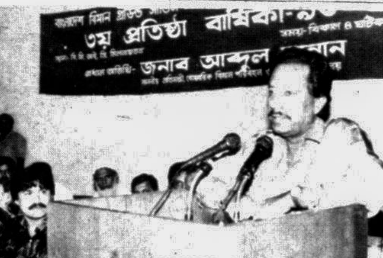
State Minister for Civil Aviation Abdur Mannan addressing the third founding anniversary of Biman Ground Service Employees' Union Sunday.