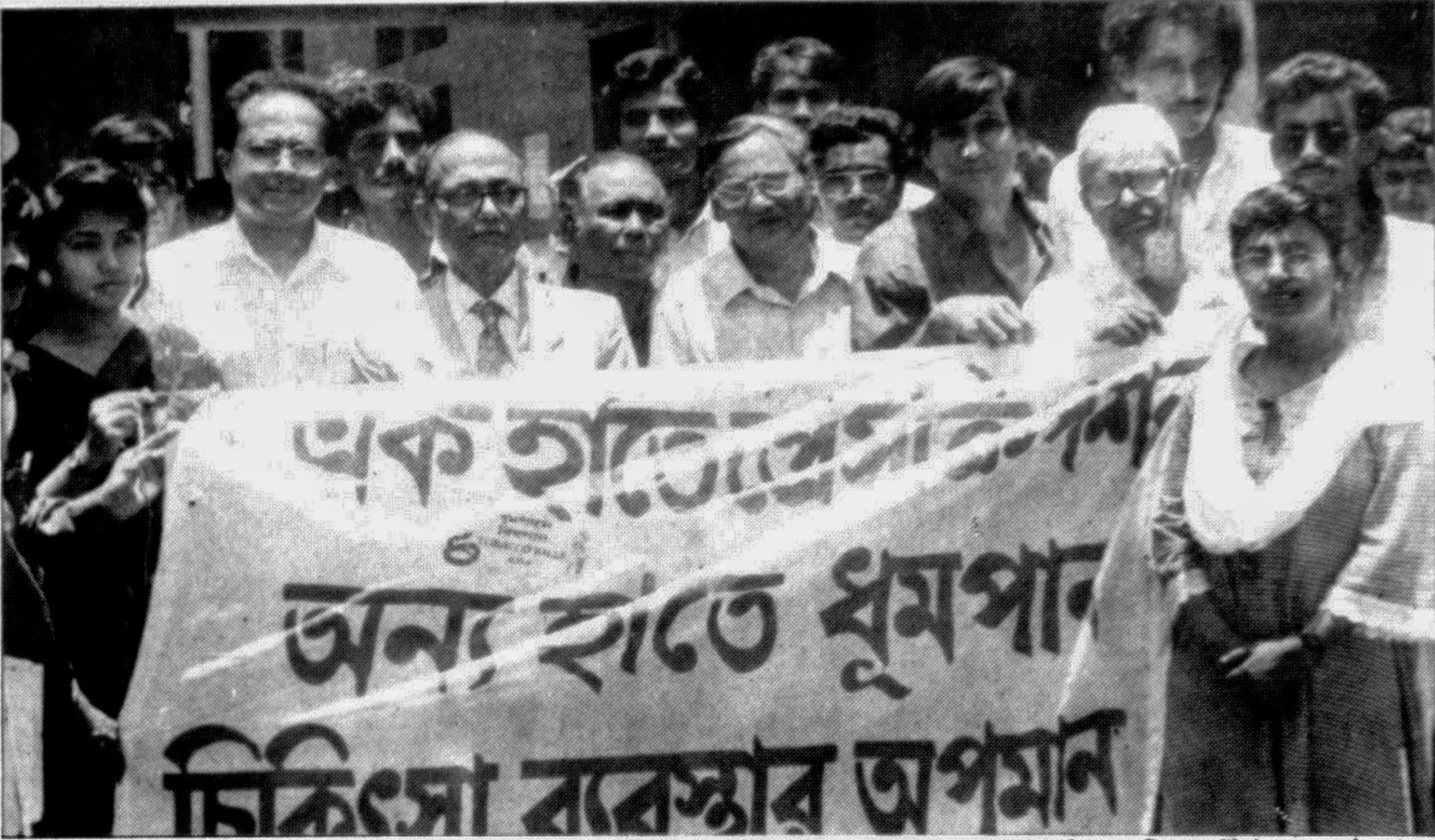
The Consumers' Association of Bangladesh and 'Adhunik' held a joint rally in front of the Jatiya Press Club yesterday in observance of the World No-tobacco Day. Related story on Page 1.

Shahbazpur High School Alumni Assoc meet June 3. A general meeting of Shahbazpur High School Alumni Association will be held on June 3, at the school premises at Shahbazpur under Sartil thana of Brahmanbaria district, reports BSS.