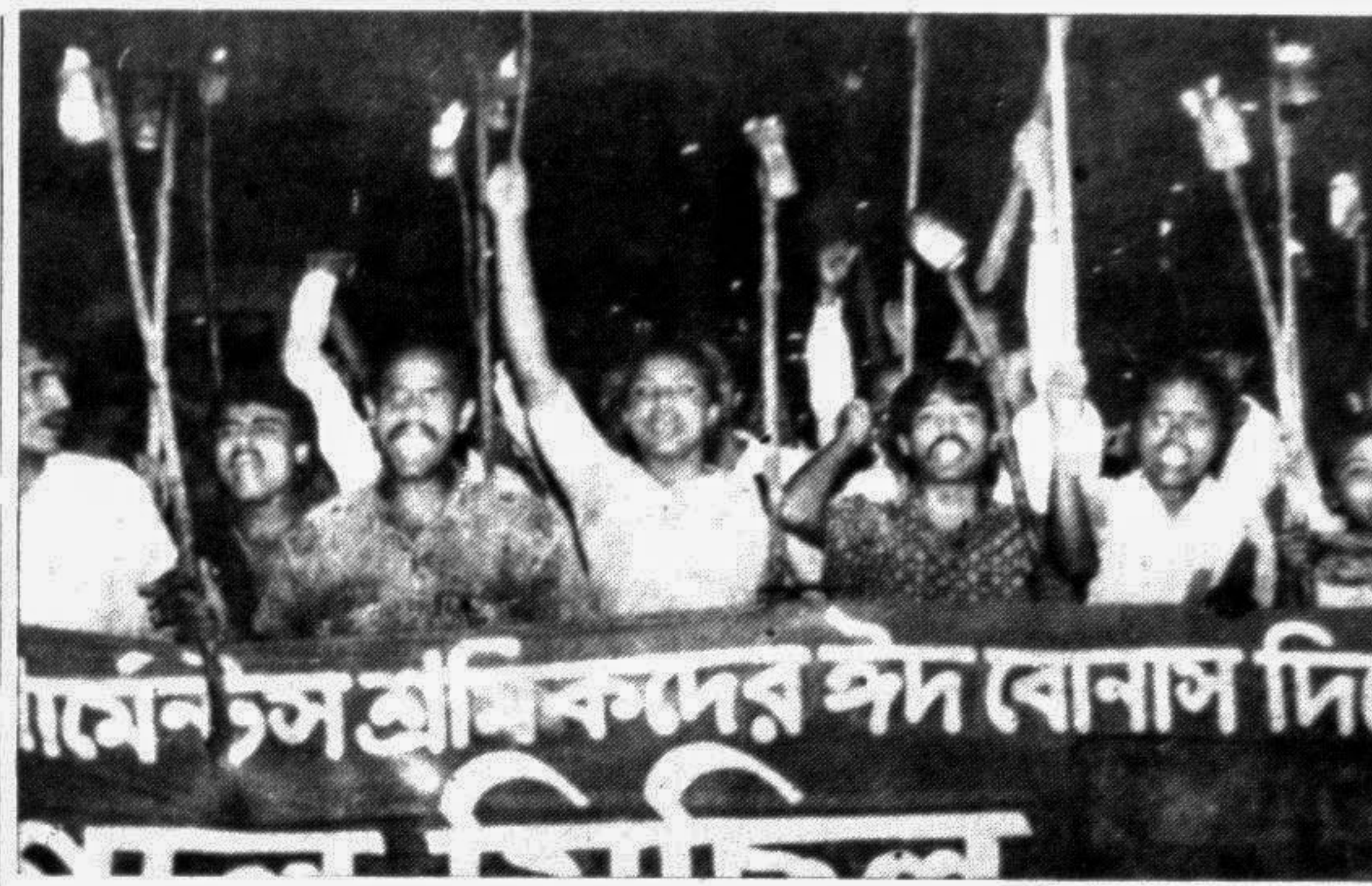
Garments workers brought out a procession in the city yesterday demanding payment of Eid bonus before May 30.

Contractors' rally A joint protest rally of contractors yesterday demanded withdrawal of VAT on construction works, says a press release. The meeting observed that if VAT was not withdrawn, development work all over the country would be hampered.