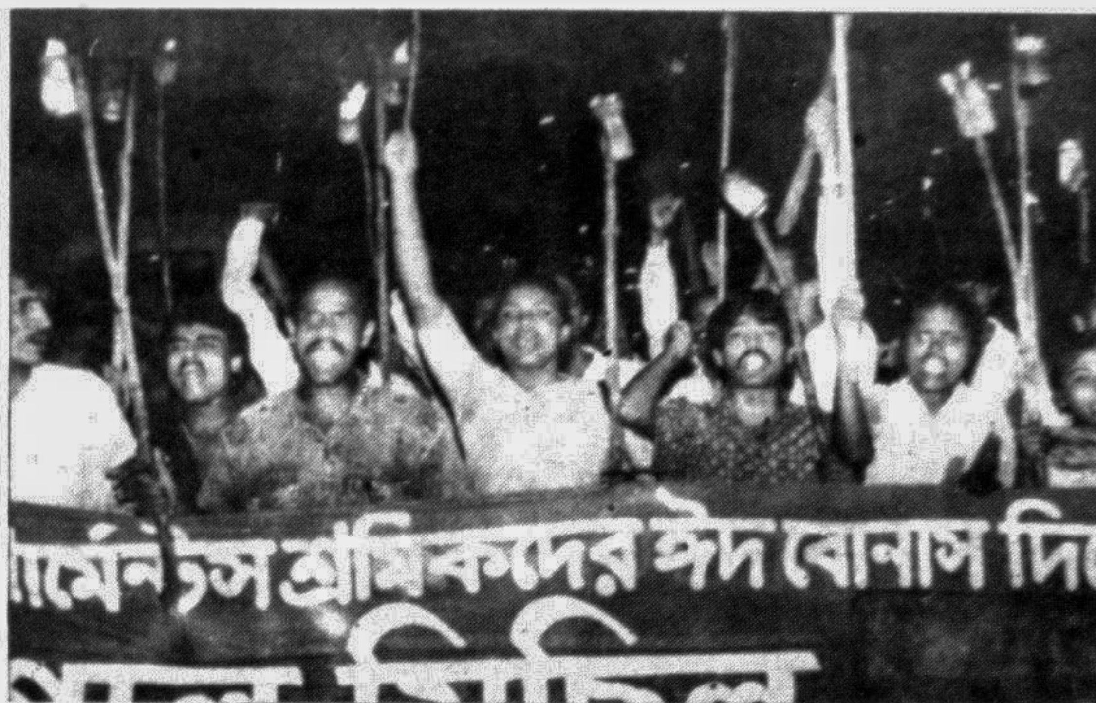
Garments workers brought out a procession in the city yesterday demanding payment of Eid bonus before May 30.

The meeting observed that if VAT was not withdrawn, development work all over the country would be hampered.