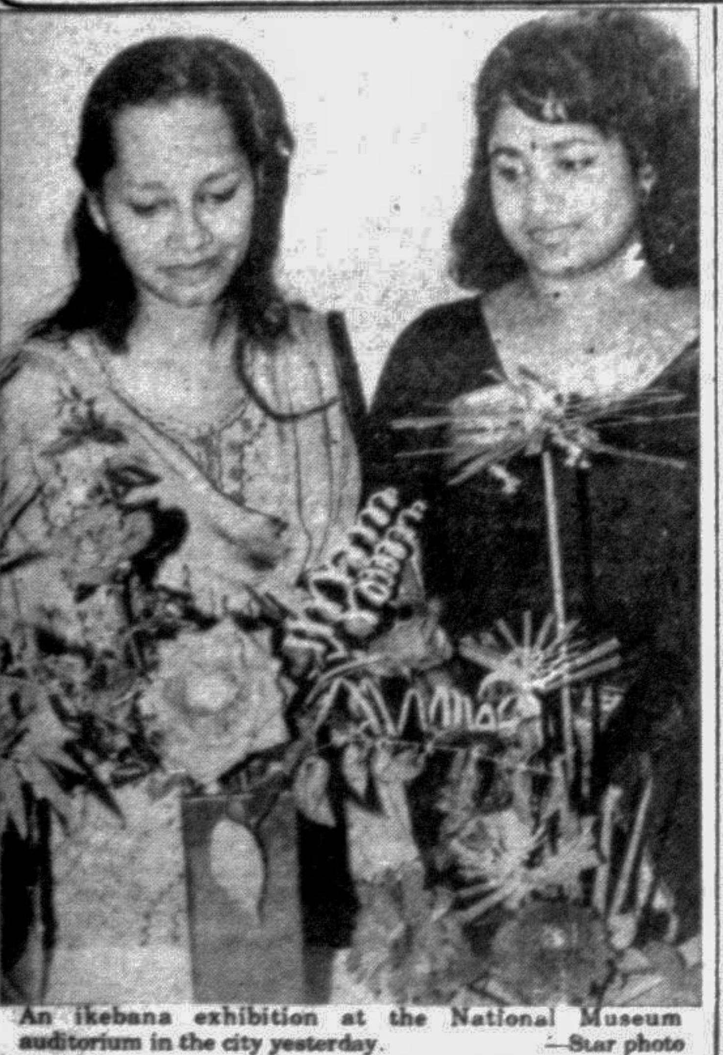
An Ikebana exhibition at the National Museum auditorium in the city yesterday.

The growing interactions between Bangladesh and Japan in different fields were adequately reflected here in a function marking the 19th annual Bangladesh-Japan cultural evening, reports BSS. The occasion was a cultural festa participated by the nationals of two countries while the function also served as a prize giving ceremony for the Ikebana contest. Health and Family Welfare Minister Chowdhury Kamal ibne Yusuf was the chief guest on the occasion at the National Museum auditorium while Japanese Ambassador in Bangladesh Toshio Saiki gave away the prizes to the winners of the Ikebana (flower making competition). The magnitude of Dhaka-Tokyo ties is very deep, ranging from economic cooperation to proximity in the cultural ties, the Health Minister said. He recalled Japan's association with Bangladesh's development efforts and said it was the single largest donor nation for this country. The Minister said many other form of cooperation and understanding in varied fields brought the two Asian nations still closer.