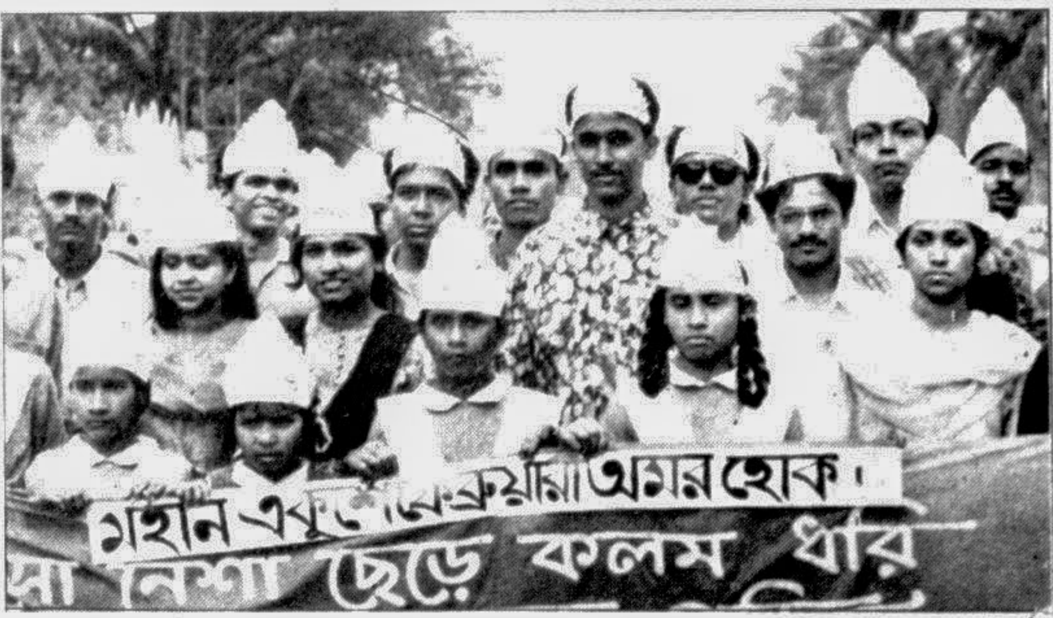
An anti-drug procession by the juvenile in the city yesterday.