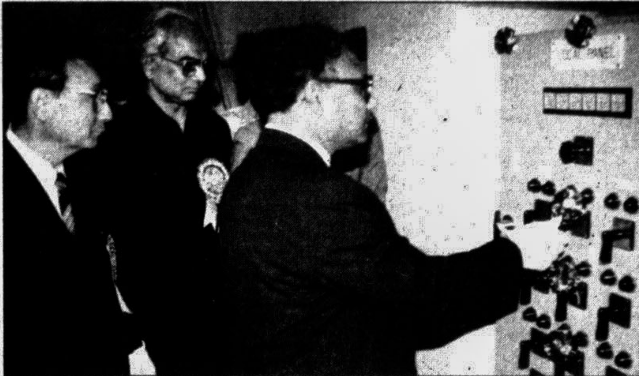
LGRD and Cooperatives Minister Abdus Salam Talukder inaugurating a pump station at Kalaynpur in the city yesterday.