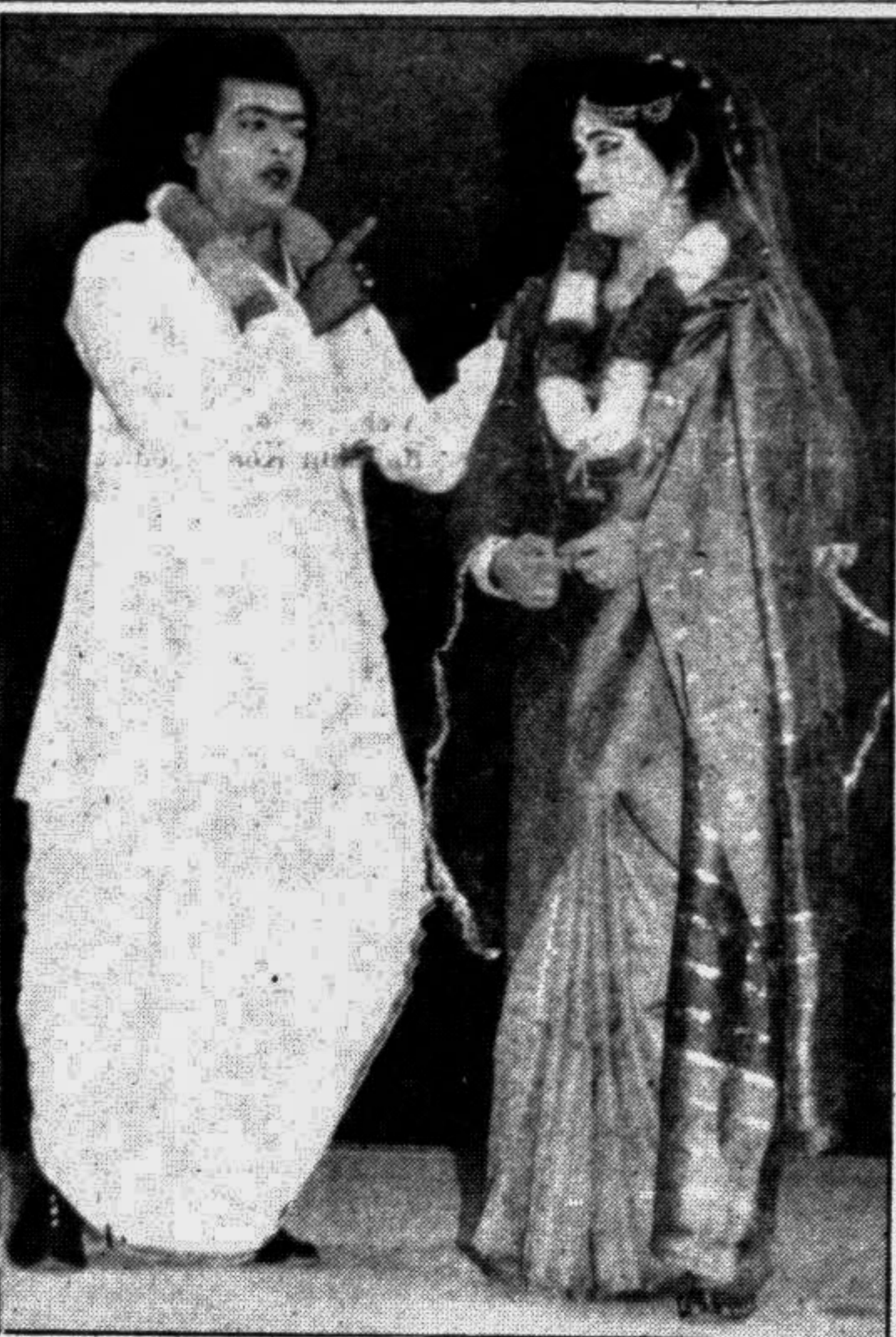
Modhumita Natya Sangha of Manikganj staged 'Ghurnizhar' in the Shilpakala Academy auditorium yesterday as part of on-going National Jatra Festival.