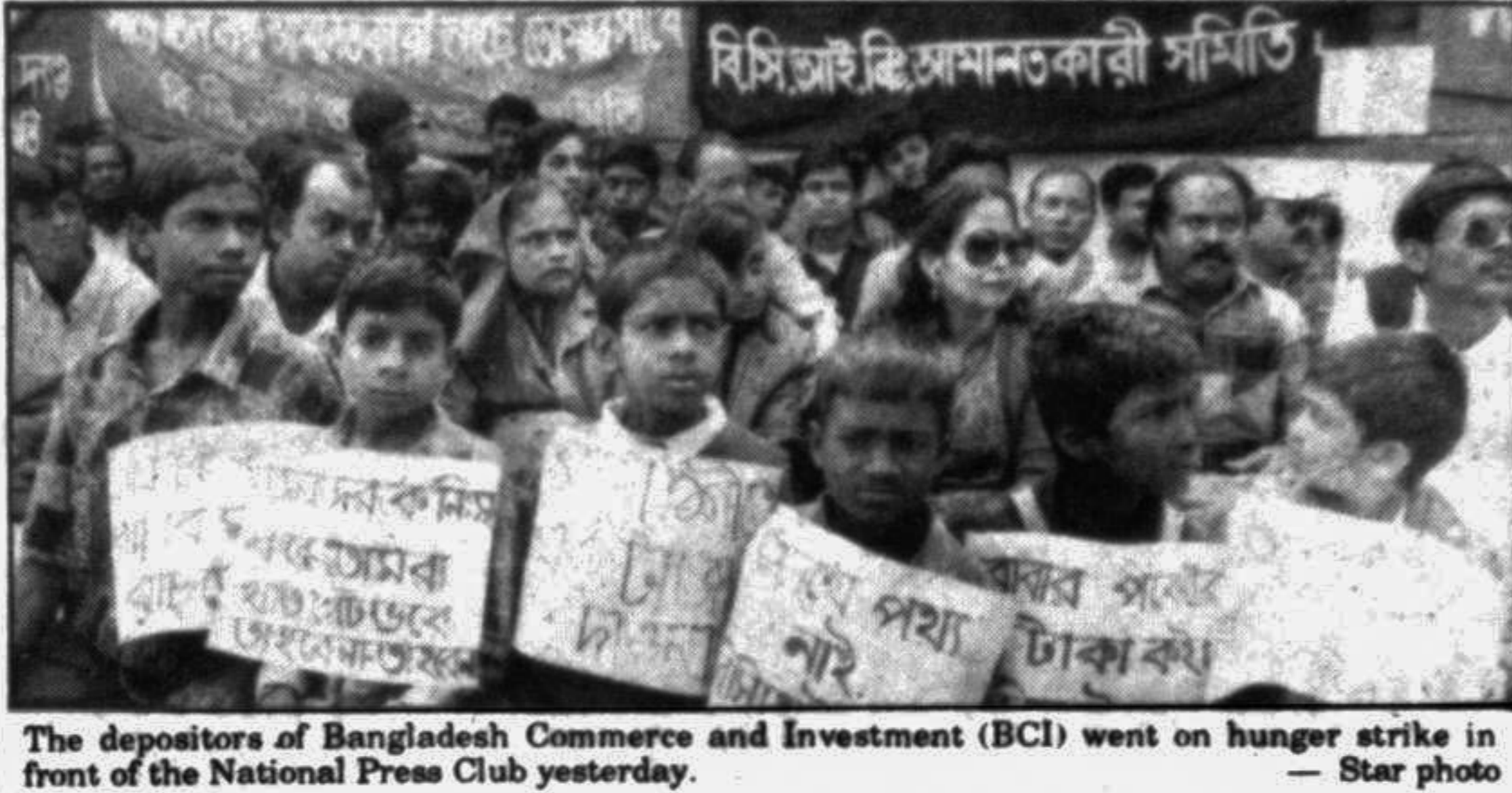
The depositors of Bangladesh Commerce and Investment (BCI) went on hunger strike in front of the National Press Club yesterday.