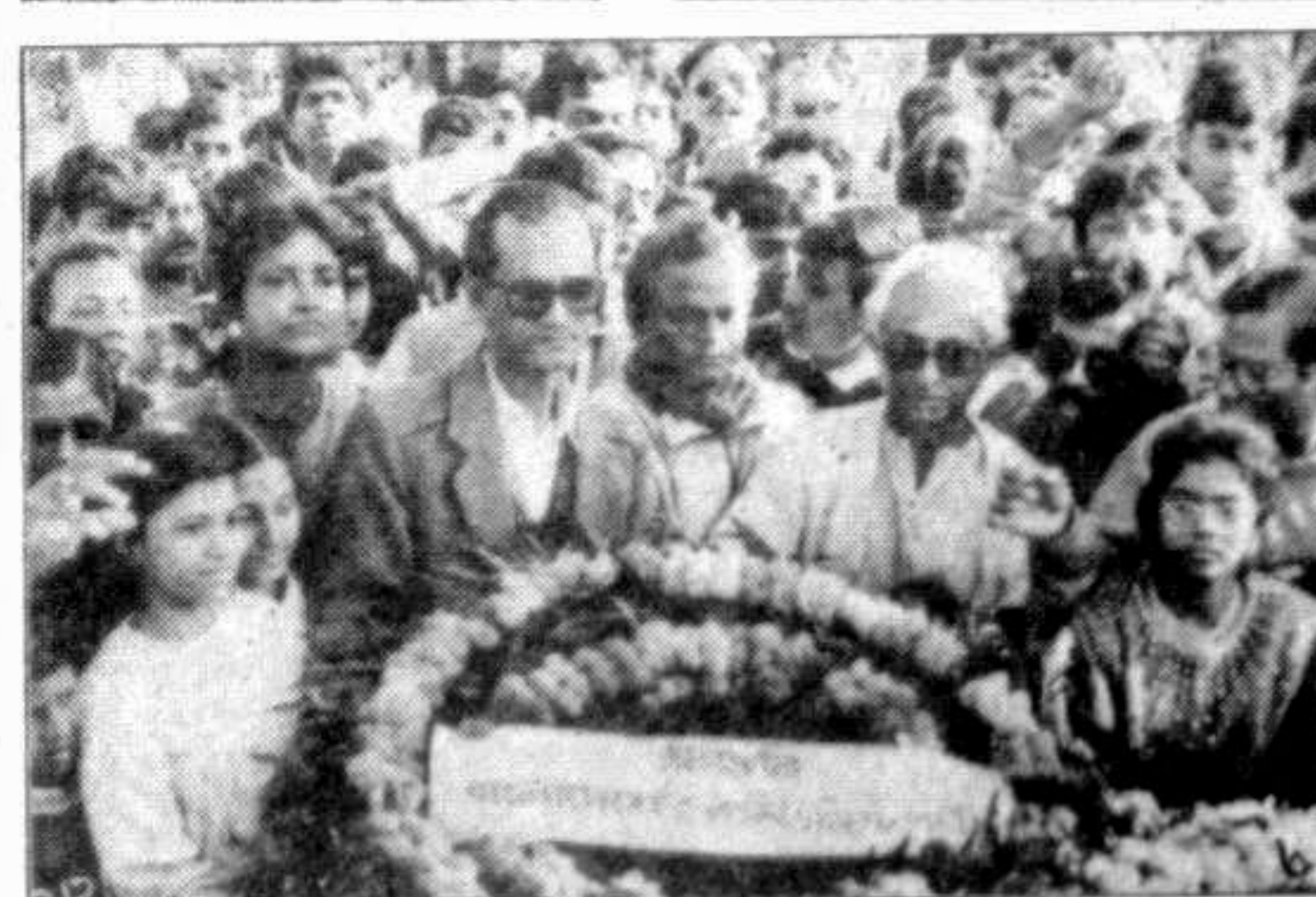
(1) Victory procession of Sammilita Sangskritik Jote. Different Organisations placing wreaths at Savar: (2) Prajanma- '71, (3) Dhaka University, (4) BUET, (5) Disabled freedom fighters and CPB