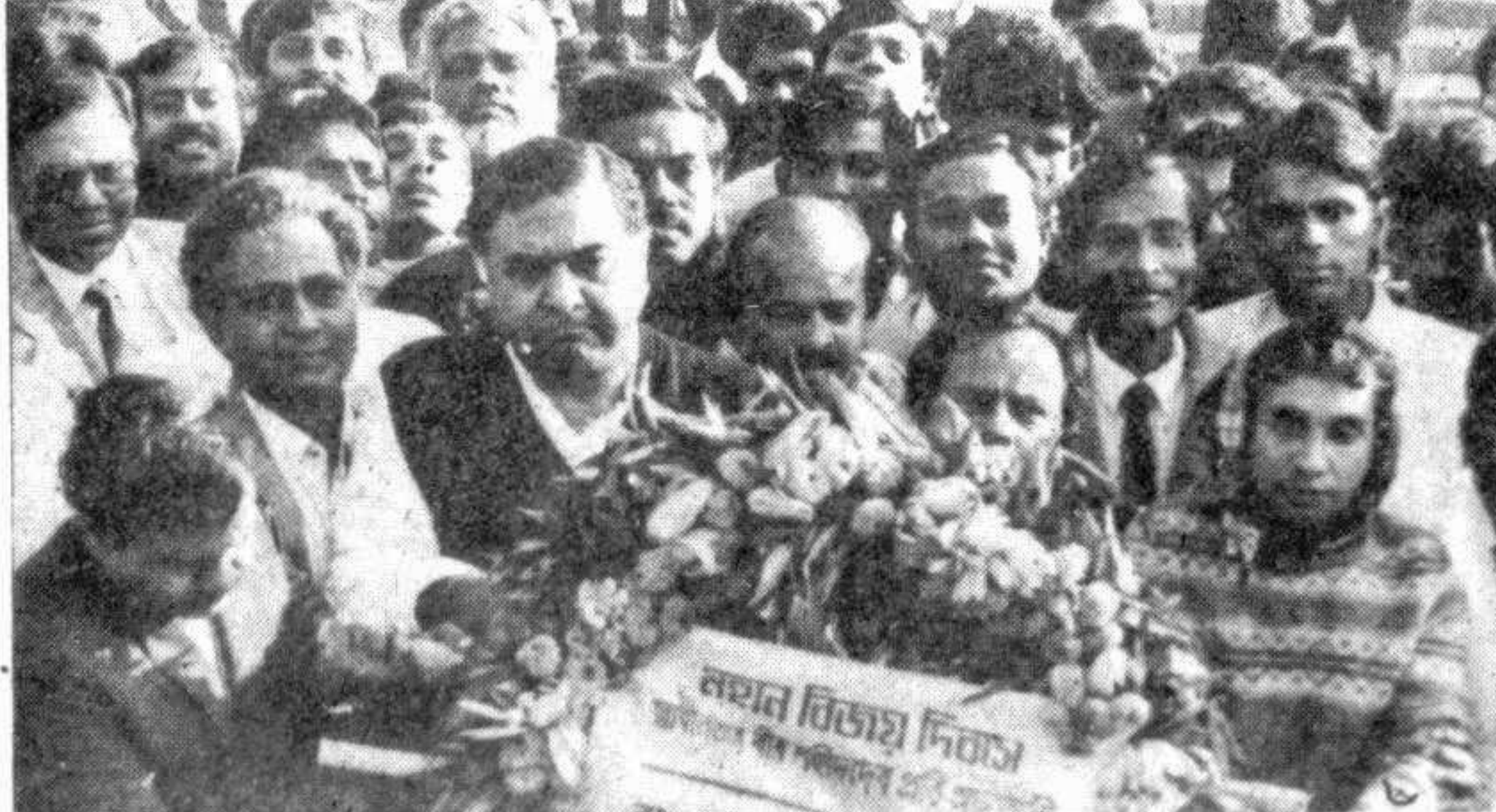
(1) President Abdur Rahman Biswas placing wreaths at the National Memorial at Savar on the occasion of the Victory Day. (2) Prime Minister Begum Khaleda Zia placing wreaths. Different other organisations including (3) BNP, (4) Awami League, (5) Nirmul body, (6) Ganatantric Forum