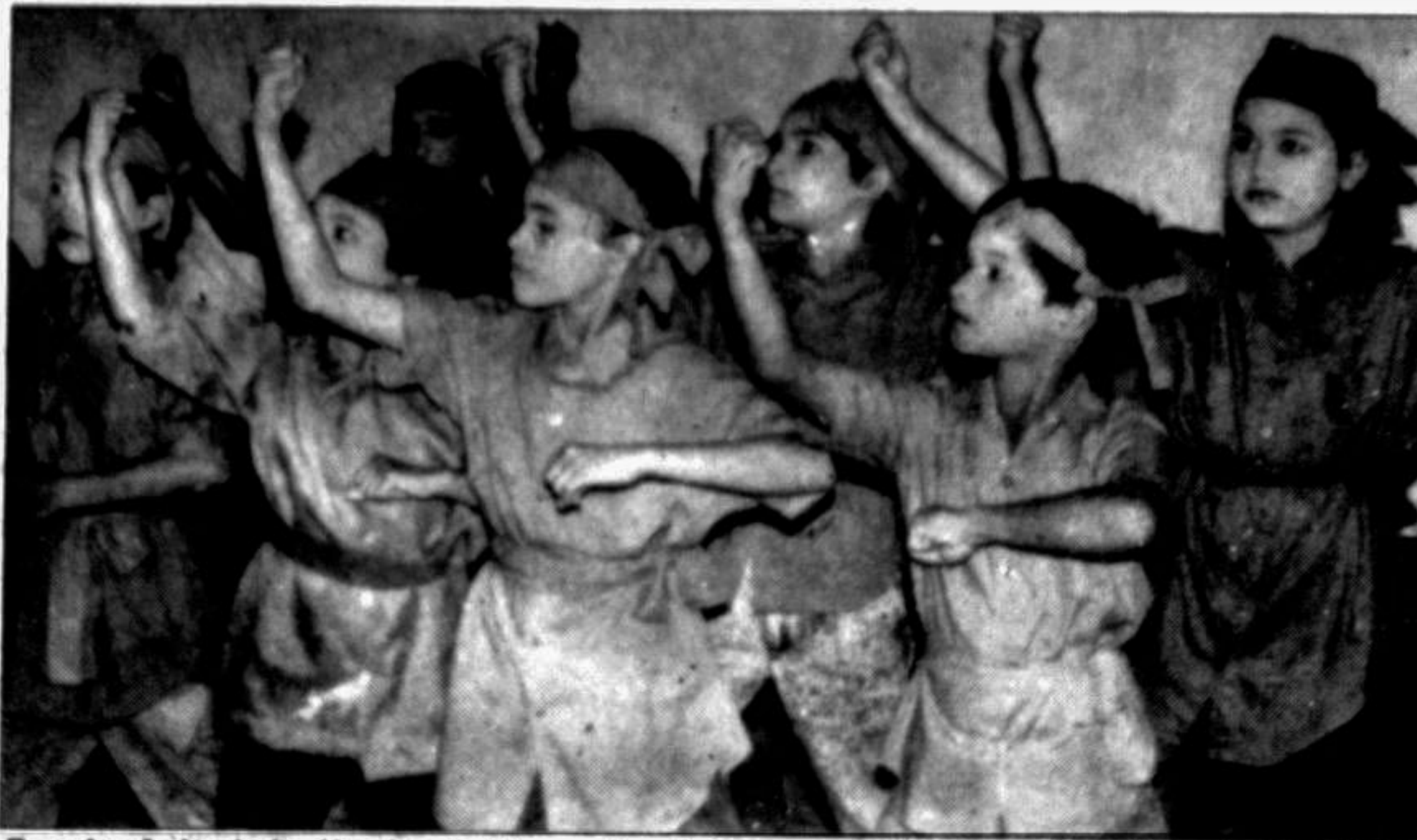
Benuka Lalitakula Kendra held a cultural function on the occasion of the installation ceremony of the new executive committee of the Kendra at the Guide House auditorium in the city on Tuesday.