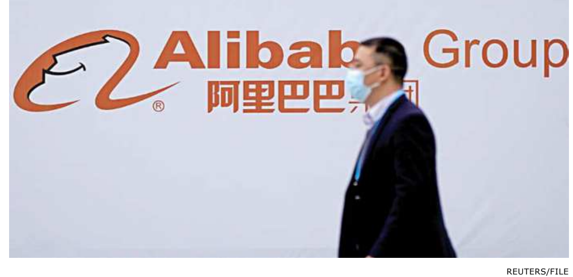
A logo of Alibaba Group is seen at the World Internet Conference in Wuzhen, Zhejiang province, China.

"choosing one from two" are required to sign exclusive statement said.