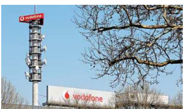
Different types of 4G, 5G and data radio relay antennas for mobile phone networks are pictured on a relay mast operated by Vodafone in Berlin, Germany.

India lost another international arbitration case this week, against Cairn Energy, over a tax dispute. It has been ordered to pay the UK-listed company over $1.2 billion in damages and costs.