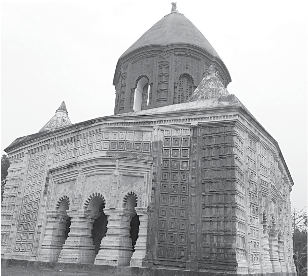
The Pancho Mondir in Naldanga of Jhenidah's Kaliganj upazila is slowly getting its splendour back during the ongoing renovation work.