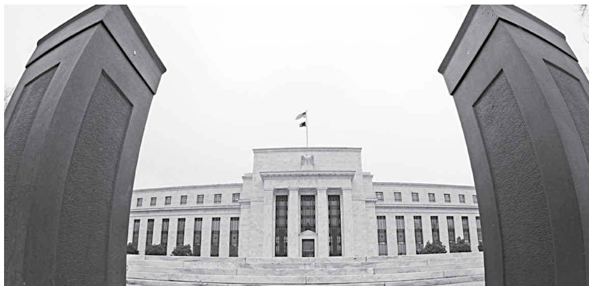
The US Federal Reserve building is seen in Washington, DC.

That's not to say Fed policymakers won't do anything at their next meeting on Dec. 15-16. Minutes from their last meeting suggest they may soon give clearer guidance on how long they'll continue to buy bonds, and under what conditions they would rev up, or pare back, asset purchases. Some 10.7 million out-of-work Americans face a cash squeeze,